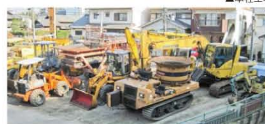
▲本社工場南ヤード