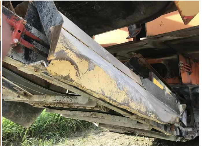
コンベアー配管保護カバー変形