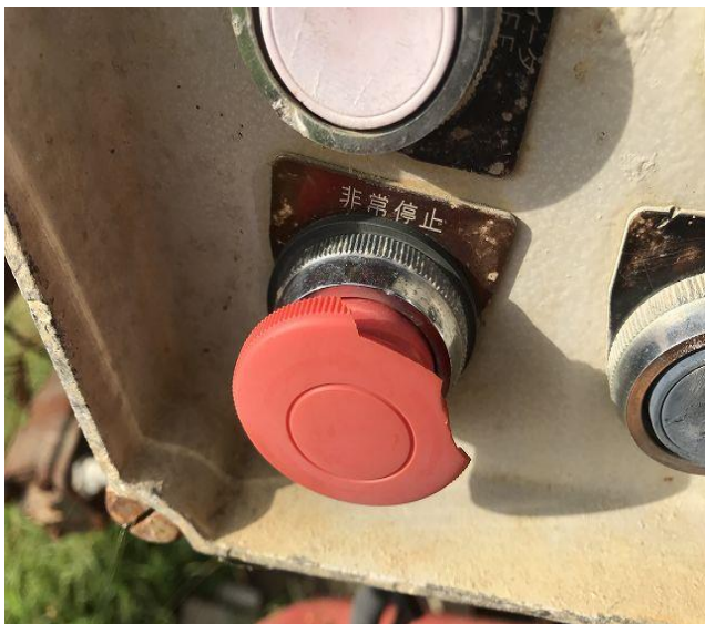
非常停止ボタン一部欠損