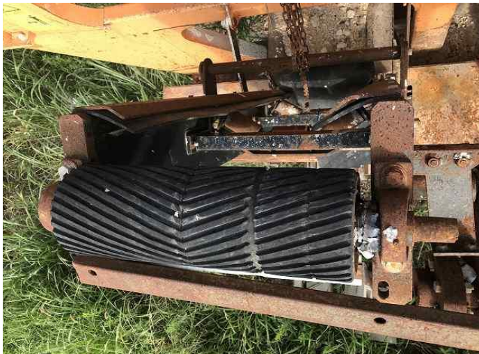
サイドベルコンブラケット破損