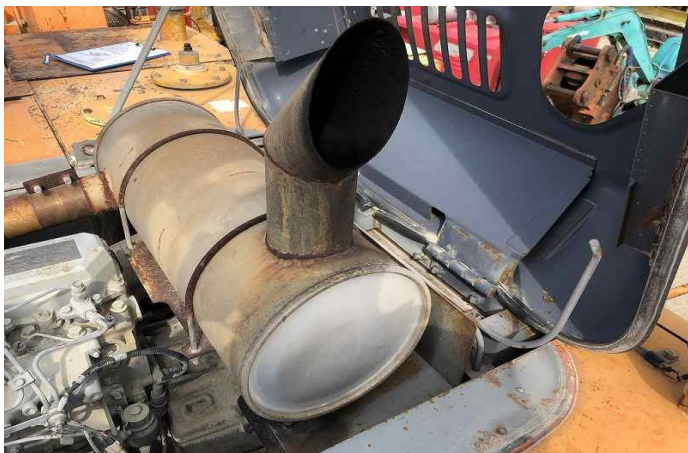
マフラー水抜きパイプ部分腐食穴あき