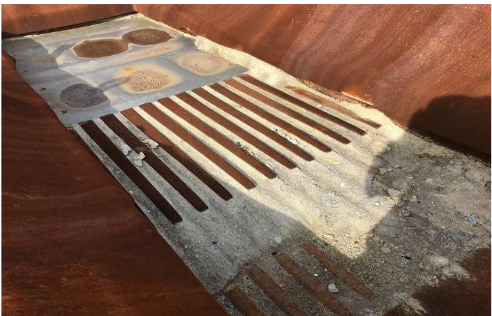
グリズリーバー摩耗