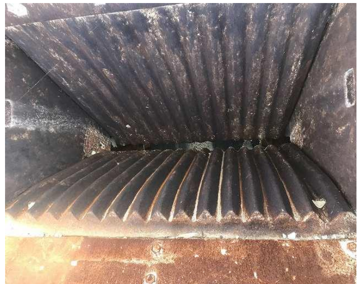
破碎室写真 (動歯摩耗有り)