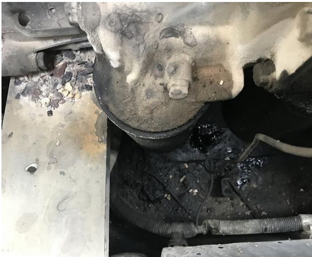
E/Gオイルエレメント (メイン・バイパス) 油洩れ