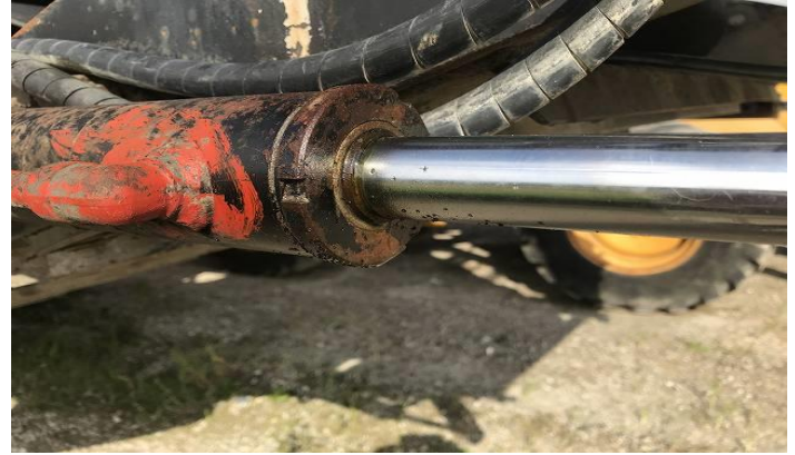
コンベアー起状シリンダー油洩れ