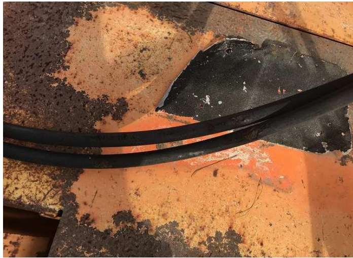
隙間調整用ジャッキ油圧ホース外装傷