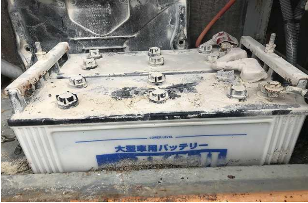
バッテリー上がり