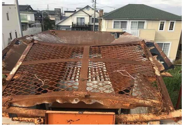
破砕室上部カバー変形