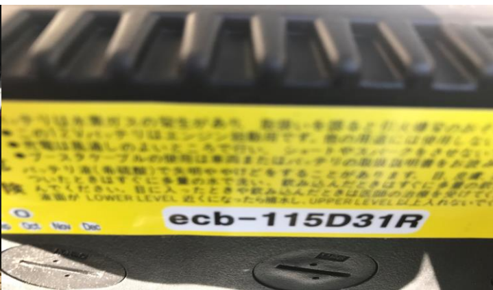
バッテリー写真 (24V) 115D31R