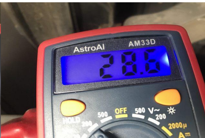
バッテリー電圧 (E/G始動後)