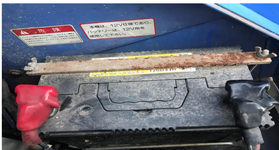
バッテリー写真 (12V) 120D31R