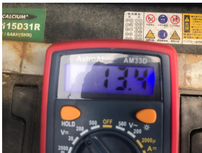
バッテリー電圧 (E/G始動前)