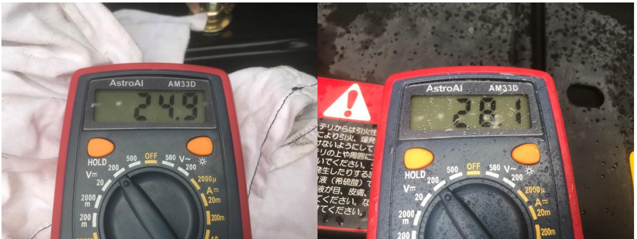
バッテリー電圧 (E/G始動前)