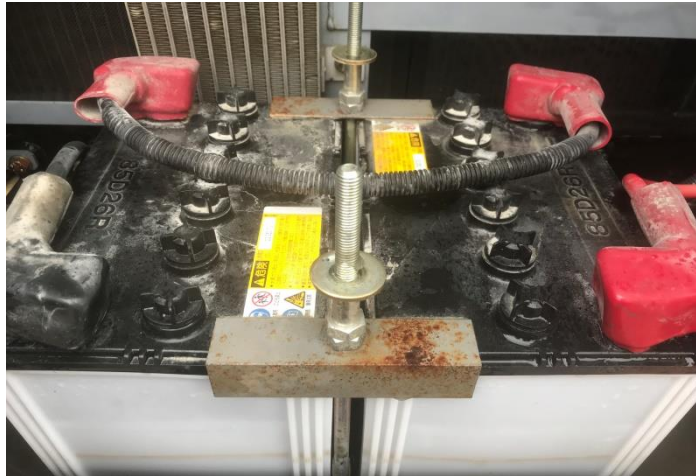
バッテリー写真 (24V) 85D26R