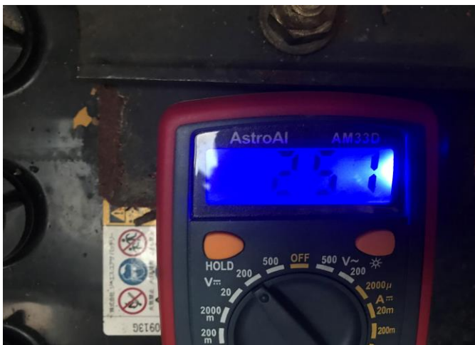
バッテリー電圧 (E/G始動前)