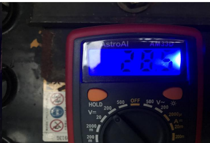
バッテリー電圧 (E/G始動後)