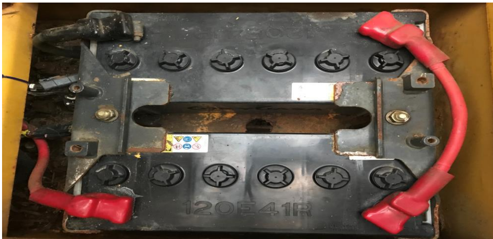
バッテリー写真 (24V) 120E41R