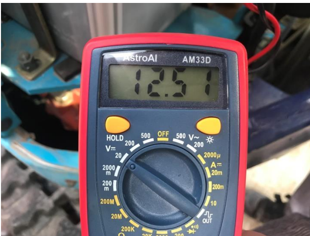
バッテリー電圧 (E/G始動前)