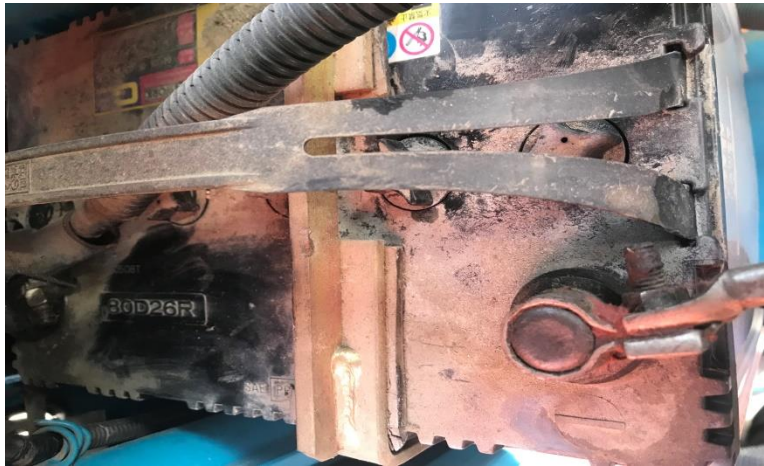
バッテリー写真 (12V) 80E26R