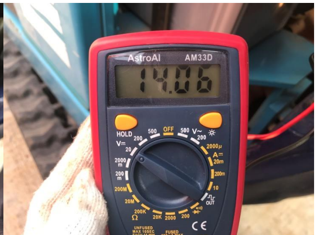
バッテリー電圧 (E/G始動後)