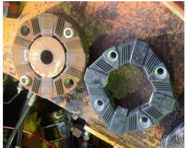
エンジンカップリング交換