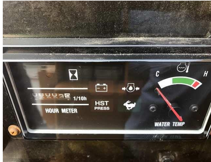
モニタパネル交換