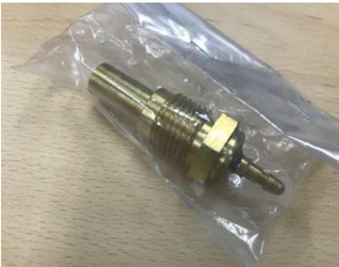
水温系並びにセンサー交換