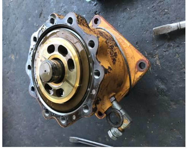
カッターモーターシール交換