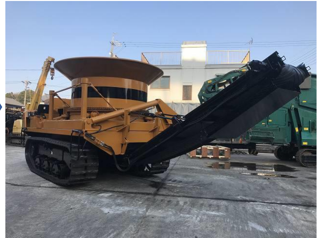
ロングベルコンへ改造 & 磁選機取り付け