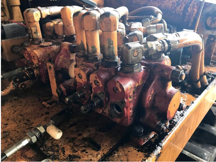
コントロールバルブ油漏れ修理