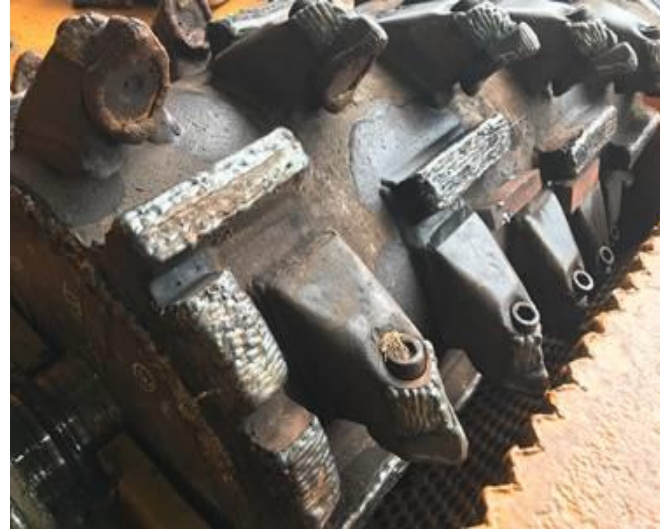
破砕ドラム肉盛り修正