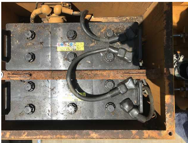
バッテリー写真 (24V) (130F51R)