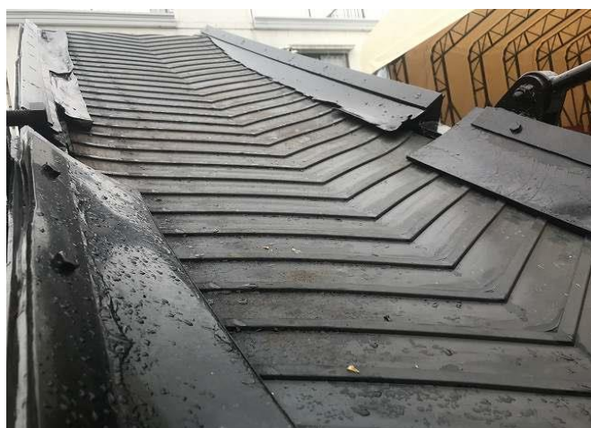
コンベアサイドゴム摩耗傷有