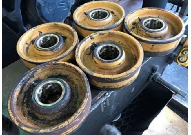
ホッパーローラーブッシュ全数交換