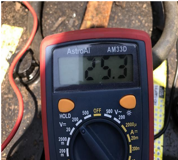
バッテリー電圧 (E/G始動前)