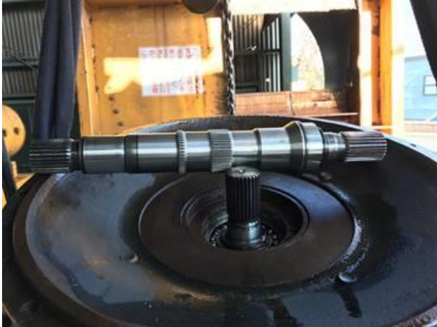
メインポンプシャフト交換