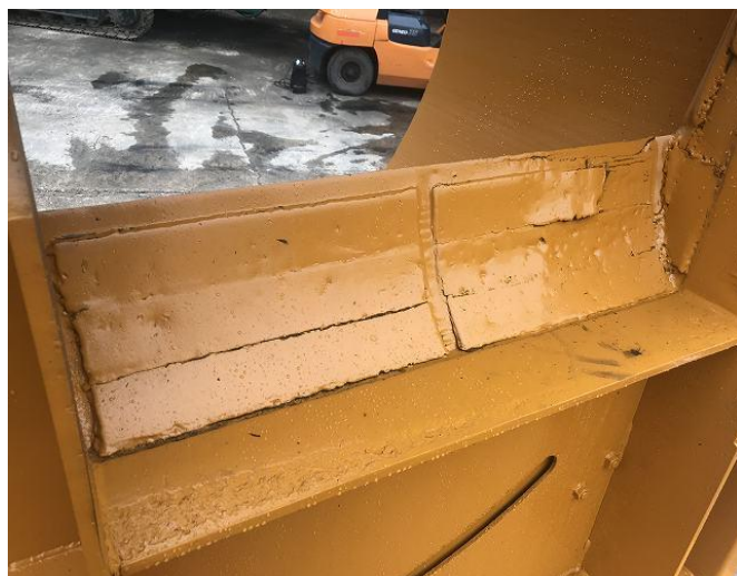
ホッパーガードフレーム補強