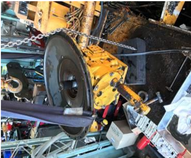
メインポンプオイル漏れの為OH