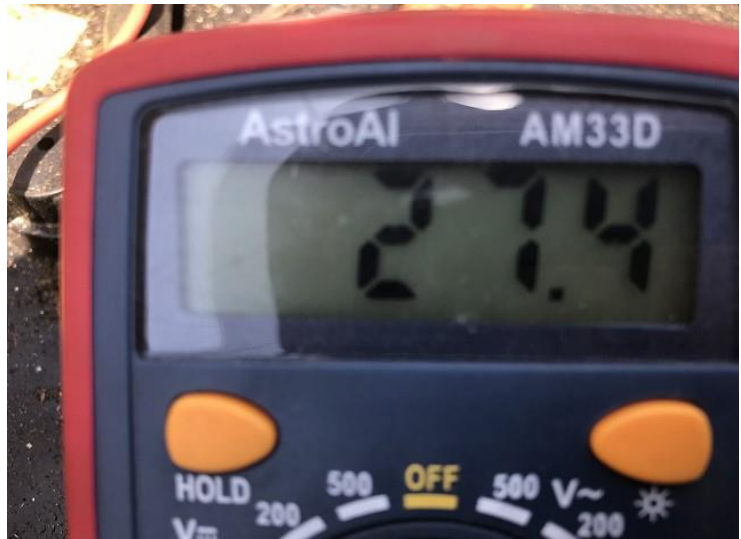
バッテリー電圧 (E/G始動後)