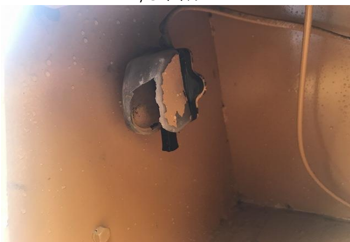
メインスイッチカバー割れ