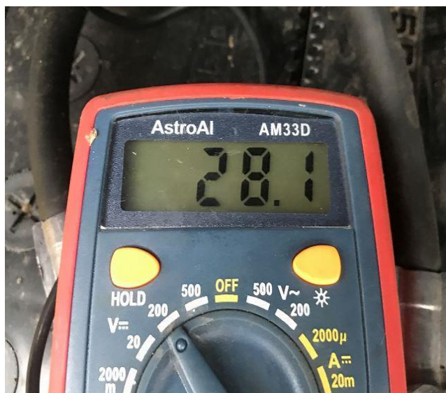
バッテリー電圧 (E/G始動後)