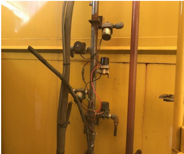
散水ソレノイド交換