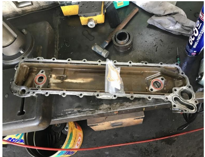
エンジンタペットカバーシール交換