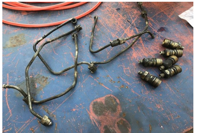
噴射ポンプノズル&パイプ交換