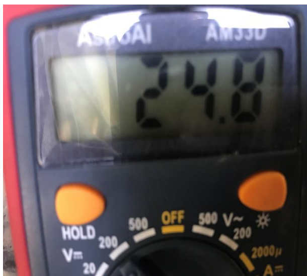
バッテリー電圧 (E/G始動前)