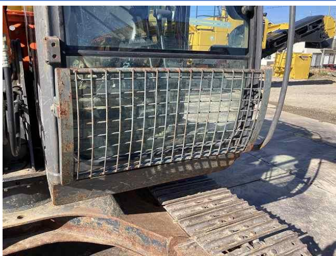
フロントガード凹み①