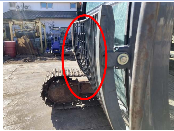
フロントガード凹み②