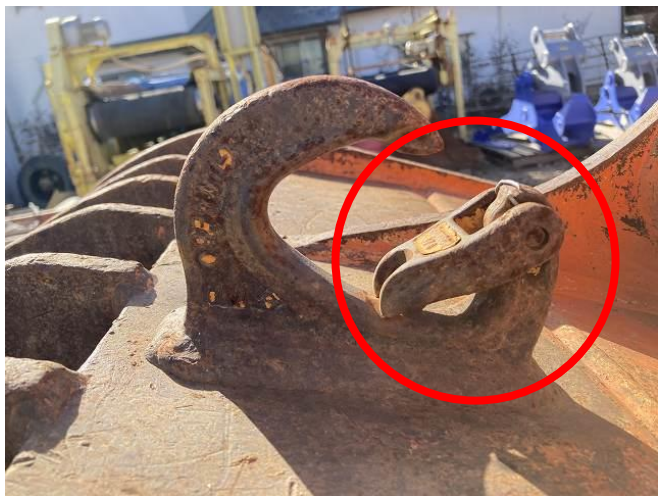
バケットフックラッチ不良②