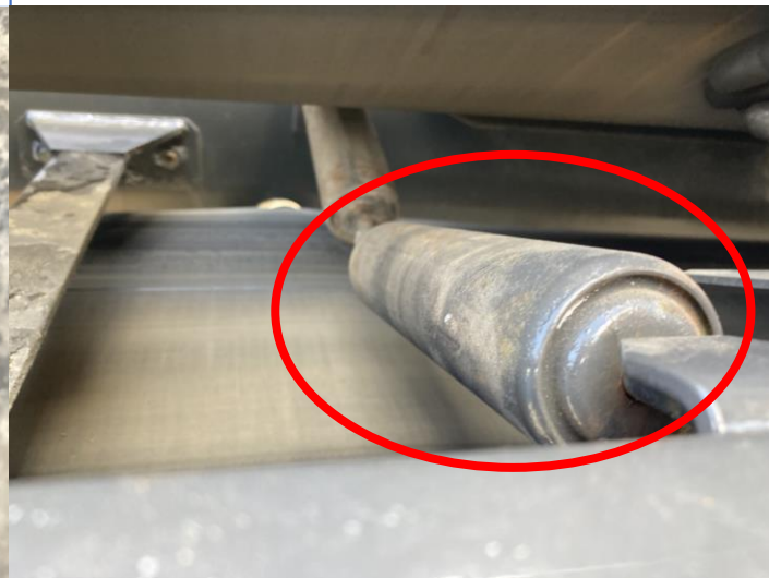
コンベヤガイドローラー固着 x 8か所