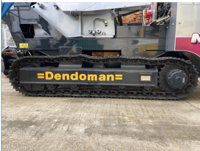
左右履帯固着あり