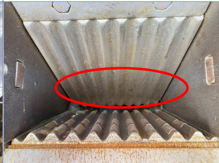
動歯摩耗（反転使用可能）