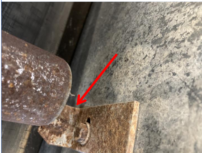
コンベヤガイドローラー軸折損 x1か所