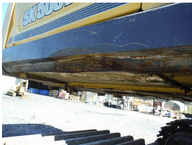
右側後方Dフレームまわり変形