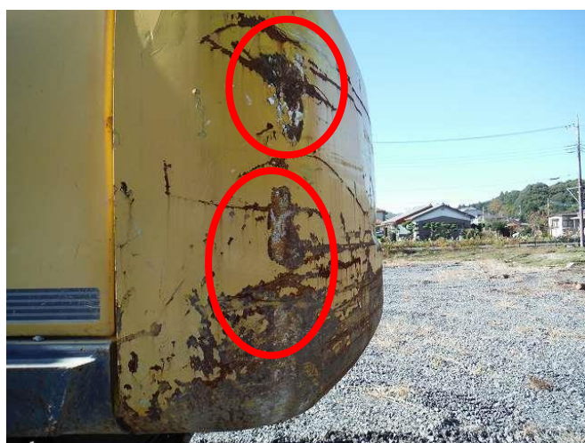
カウンターウエイトキズへこみ