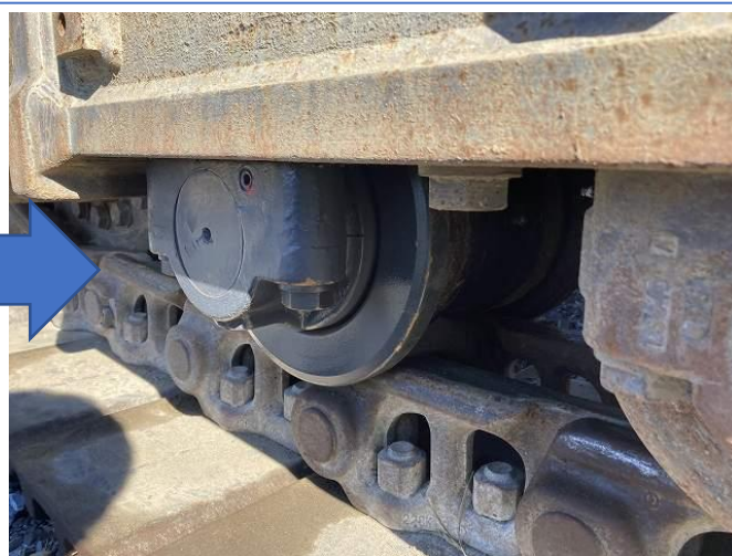
右側足回り下部ローラー交換(1個)