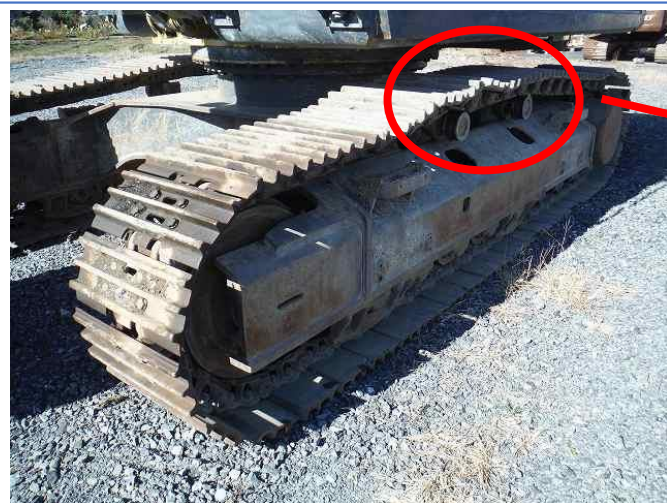
左側クローラーリンク①