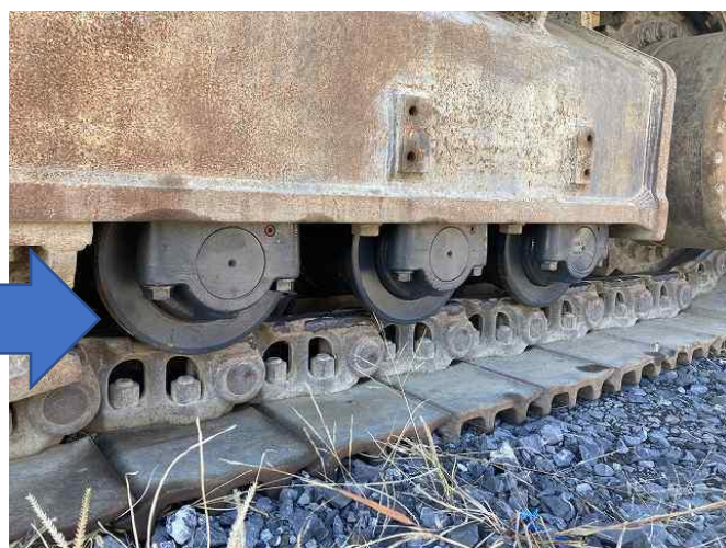
左側足回り下部ローラー交換(3個)