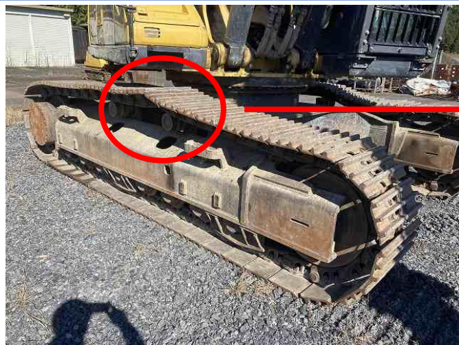
右側クローラーリンク①