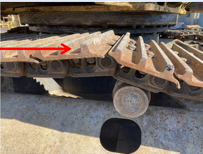
右側クローラーリンク②