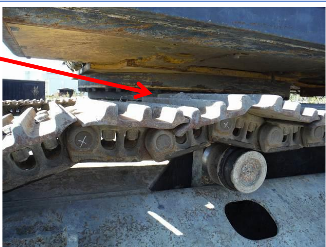
左側クローラーリンク②