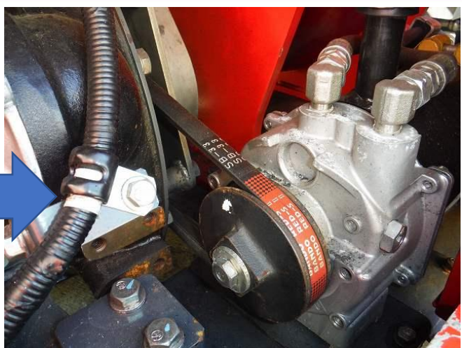
クラッチドライブベルト交換