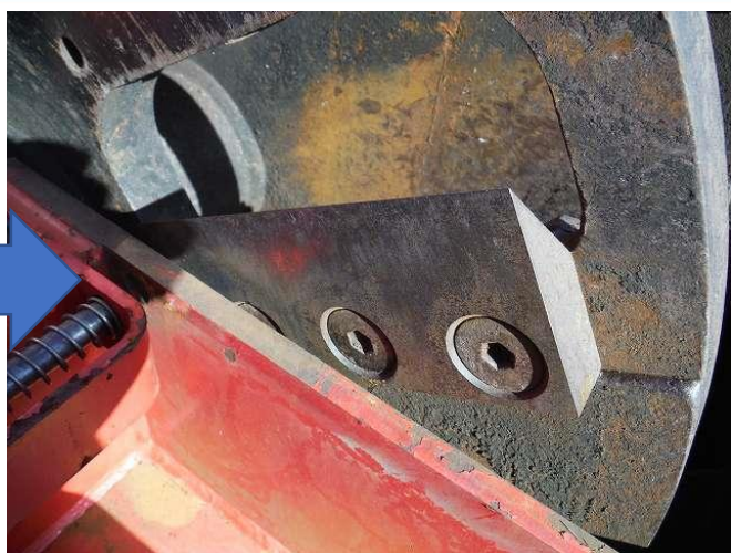
チッパーナイフ交換