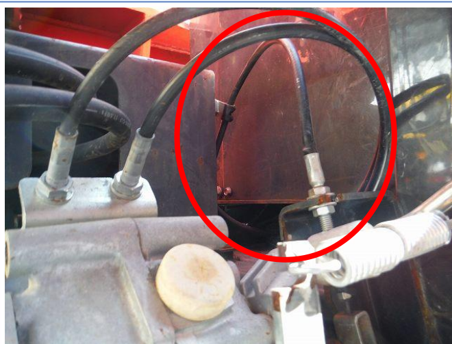
クラッチワイヤー交換