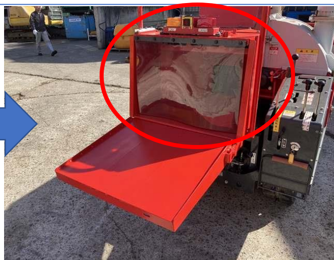
投入ホッパー変形板金修理