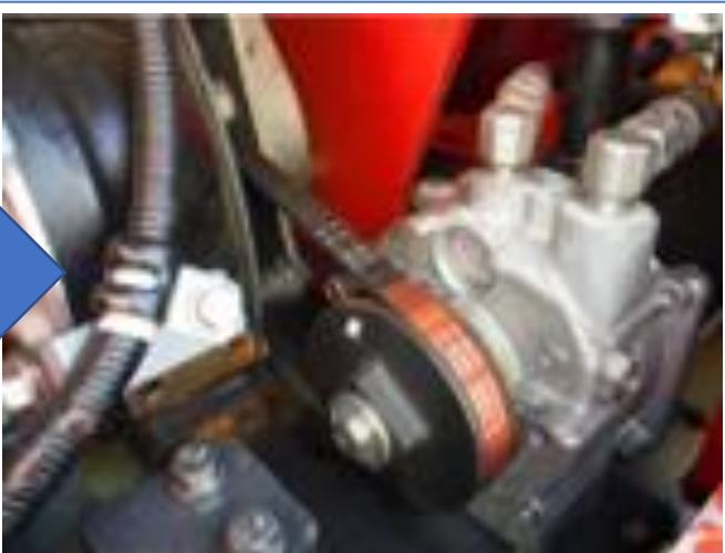
クラッチベルト交換