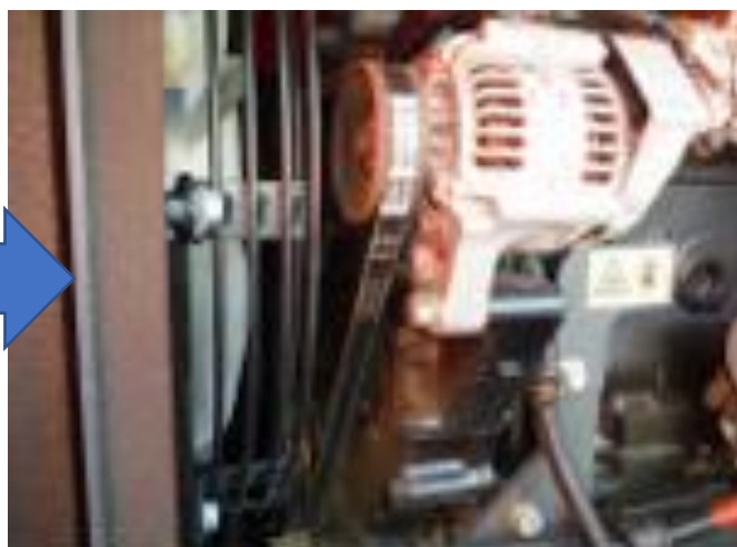
ファンベルト交換