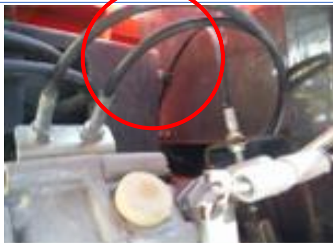
クラッチワイヤー交換