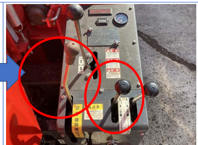
クラッチレバー&走行左レバー交換