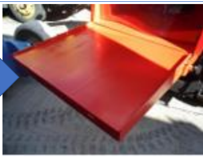
投入補ホッパーテーブル板金修正