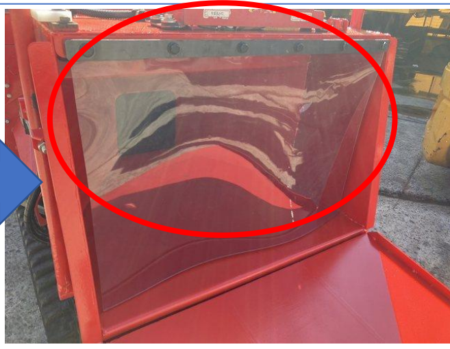
投入ホッパー口保護シート交換