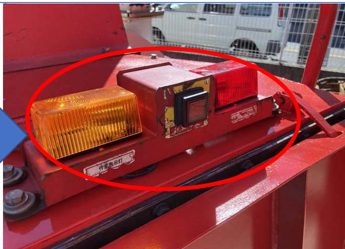
非常停止ボタンユニット交換