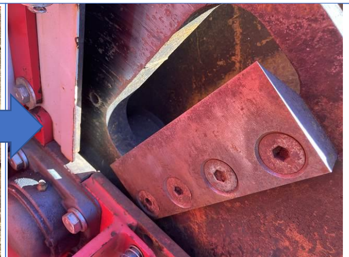
チップナーナイフ全交換