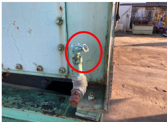
作動油ドレンバルブハンドル破損