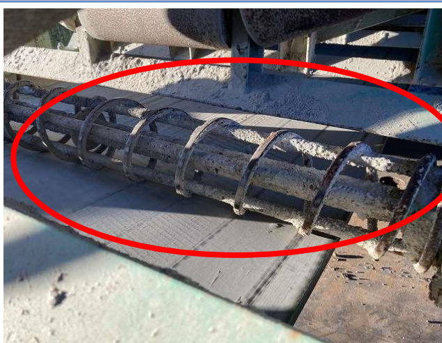
ベルコン下部スパイラルローラー不良