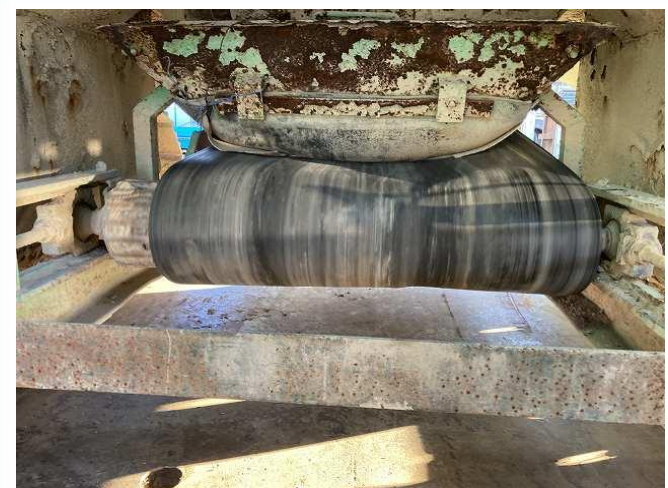
ベルコン偏り（右ズレ）