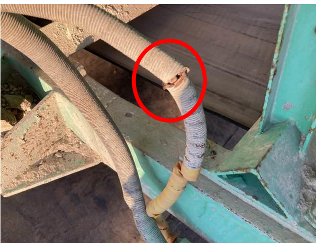
ベルコンモーター配線カバー破損散見