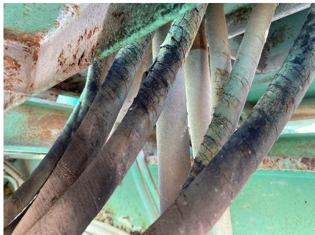
各油圧ホース劣化ひび割れ