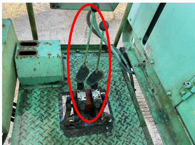
走行レバーガタ付きあり