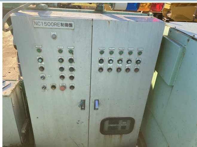
自動モード操作不能