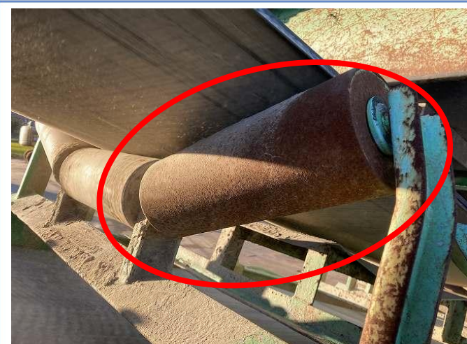
ベルコンサイドローラー固着1か所固着