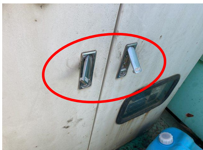
操作配電BOX開閉ノブ不良