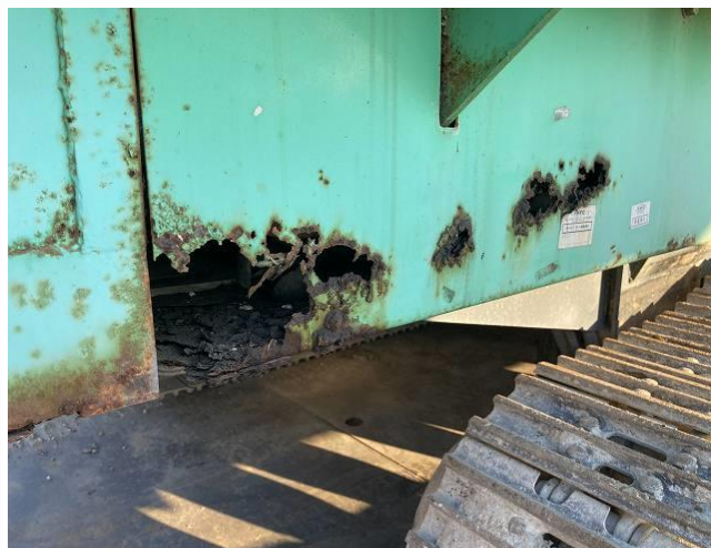
本体錆びによる腐蝕穴散見