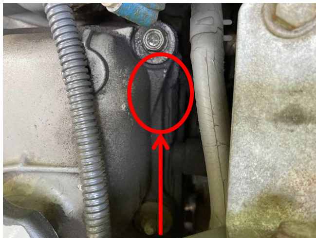
E/Gタペットカバーパッキン油滲み