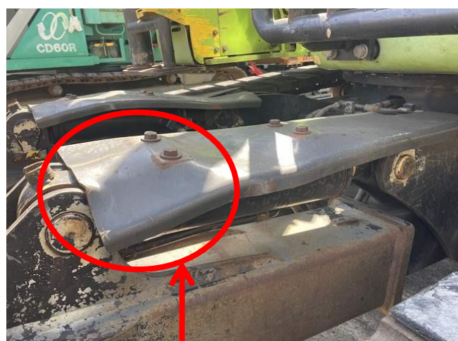
排土板シリンダーカバー変形