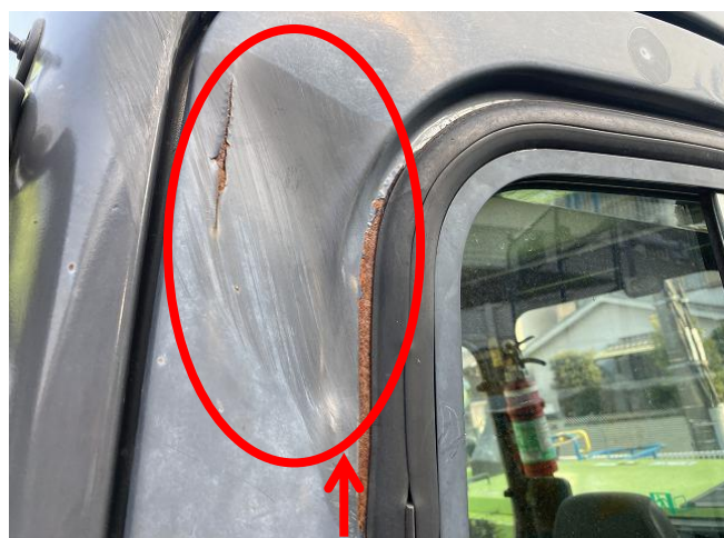
キャビンドア変形