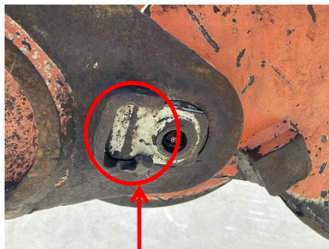
グラップルフォークピンストッパー破損