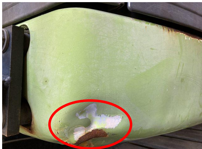
サイドフレーム変形