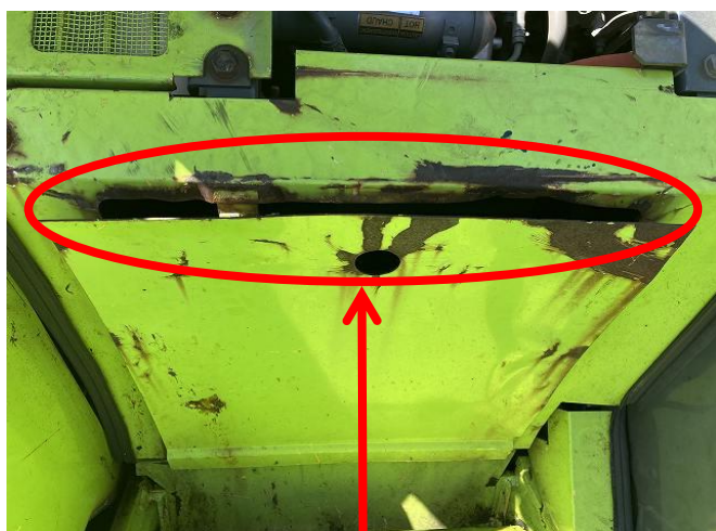
旋回装置カバー変形