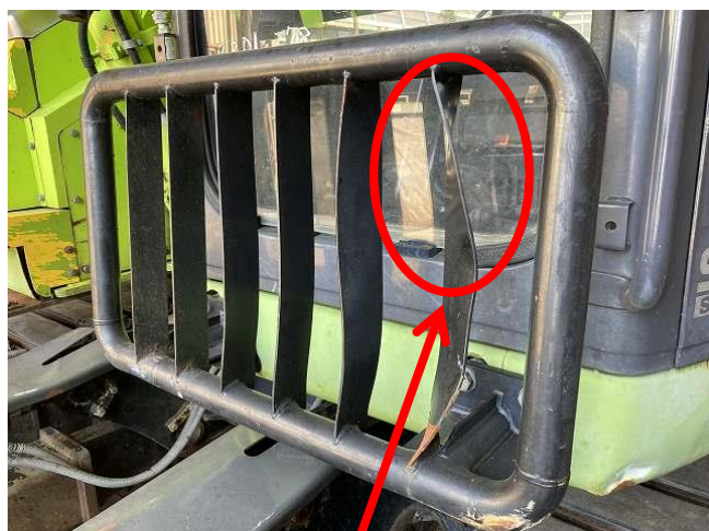
キャビンガード変形