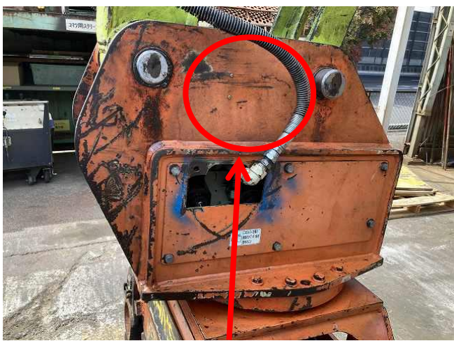
グラップル銘板欠損