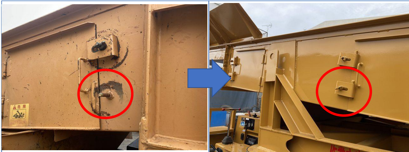
サイドカバー固定ブラケット欠損の為取り付け