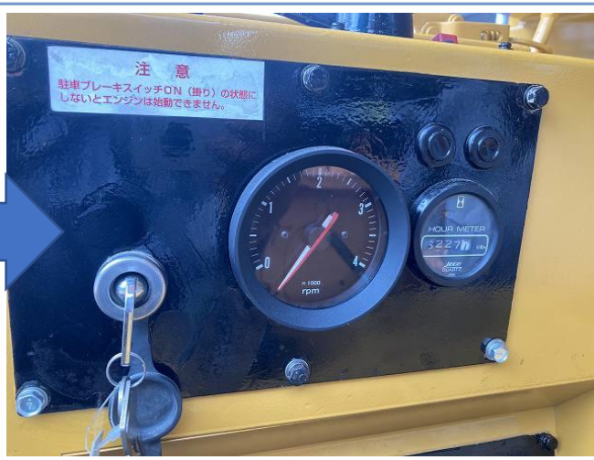
タコメーター交換