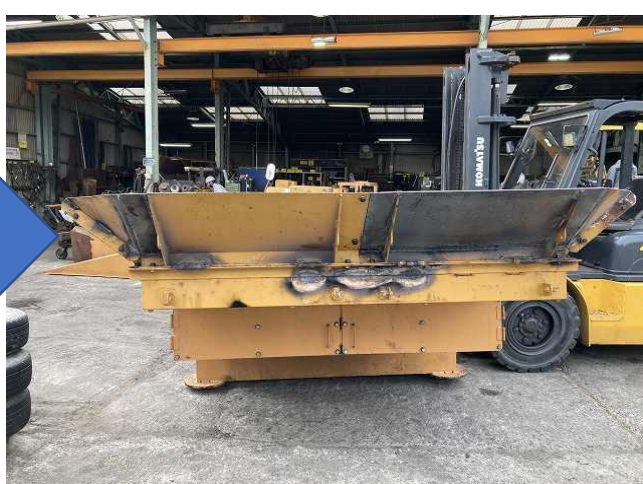
ホッパー変形凹みの為補強、板金