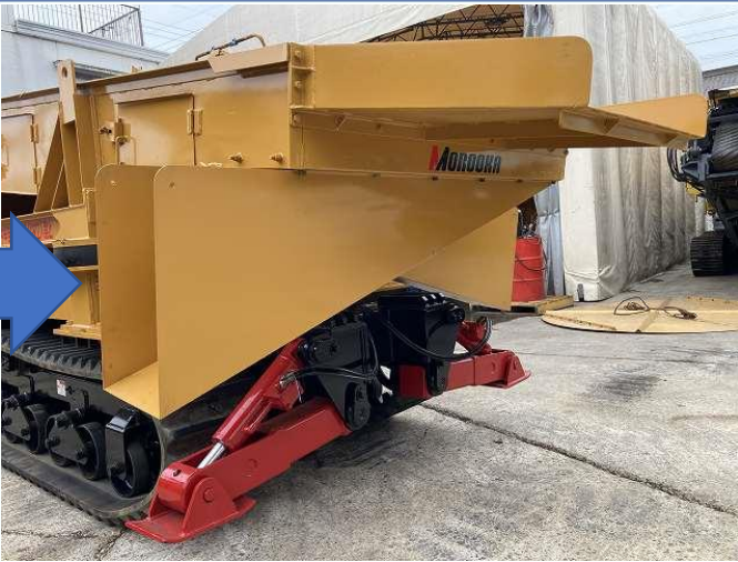
サイドシューター製作交換