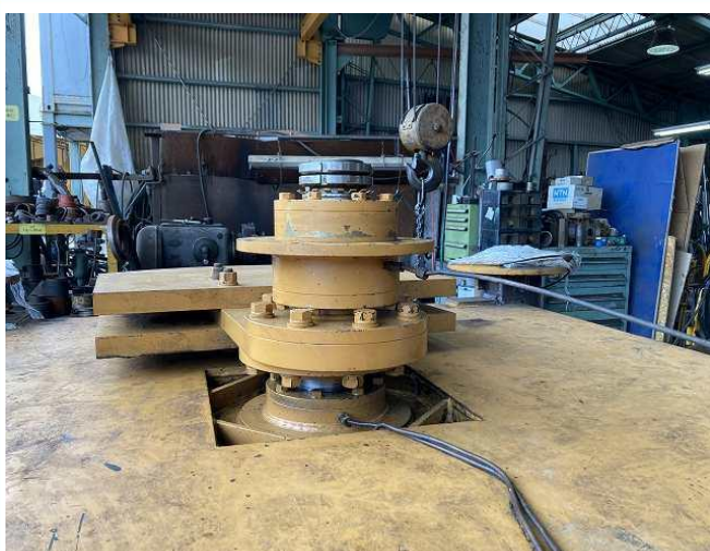
スクリーンデッキ脱着メインベアリング位置調整