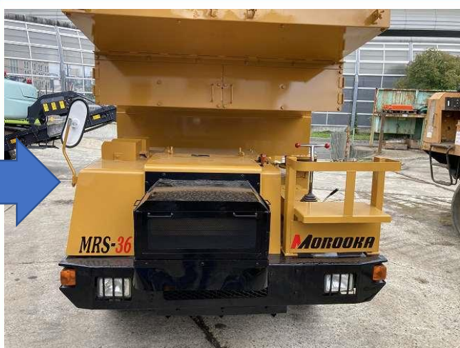
フロントバンパー変形の為板金修理