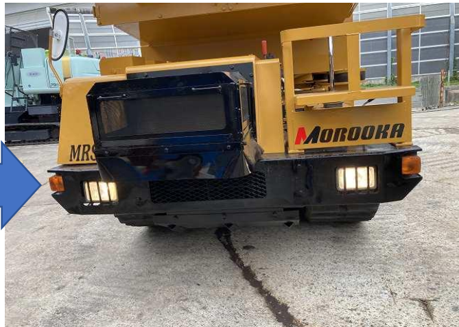
左右ウィンカー&amp;ライト不良交換