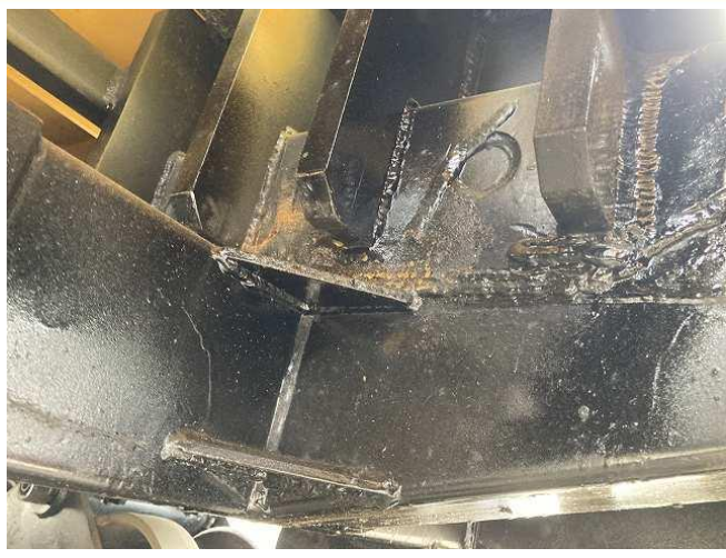
シャーシフレーム及びスクリーンフレーム再補強