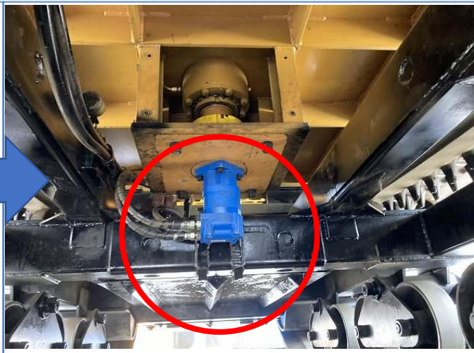
ロータリーモーター不良の為交換