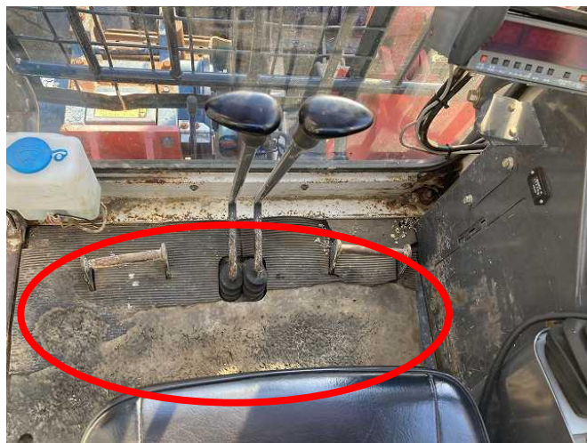
CAB内足元マット劣化