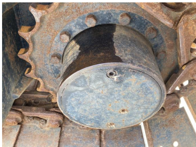
左側走行減速機油漏れ