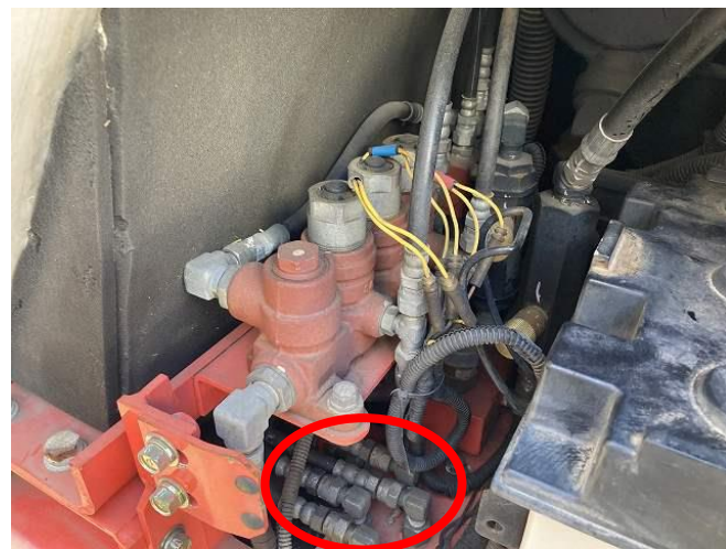
バルブホース口金油にじみ