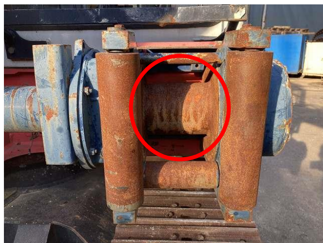
ウインチワイヤー欠損