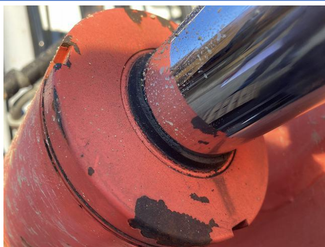
ブームシリンダー油にじみ