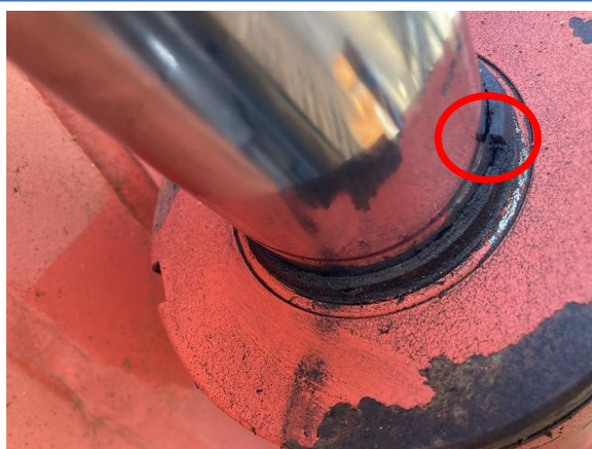
ブームシリンダーシール破損