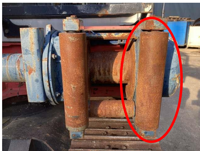
ウインチ右側ガイドローラー固着