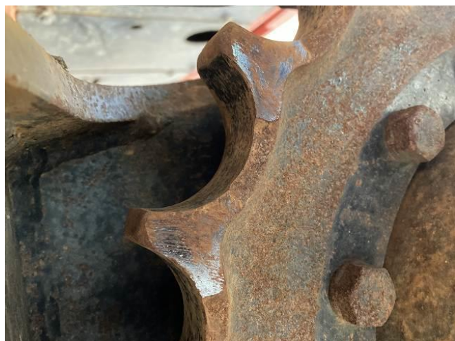
スプロケット摩耗(小程度)