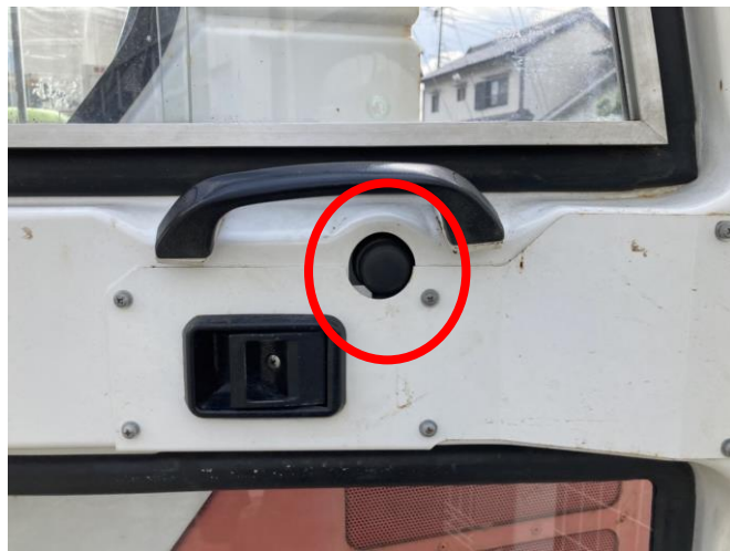
ドアキャッチ解除ボタン不良気味