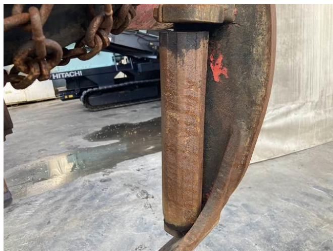
プロセッサグラップルローラー1個固着