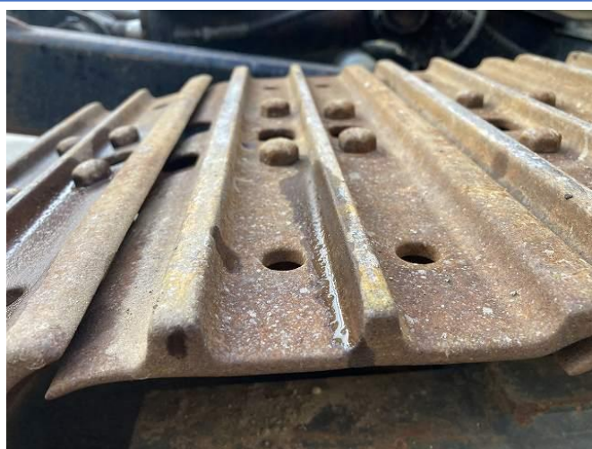
シュープレート摩耗(中程度)