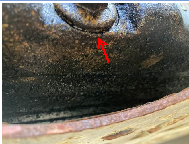
オイルパンドレンボルト付近油漏れ