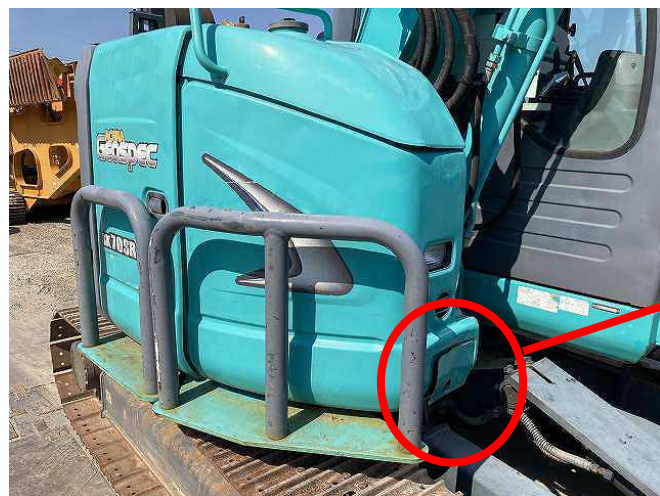
小物収納カバー変形①