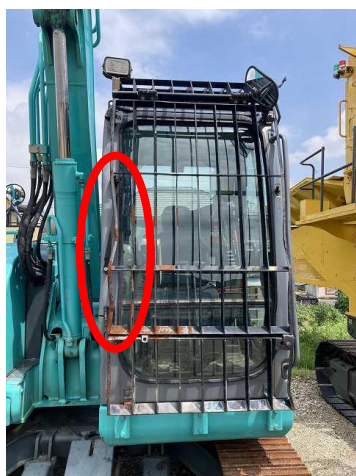
フロントガード変形