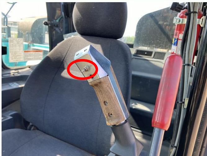
左操作レバー背面ボタンキャップ欠損