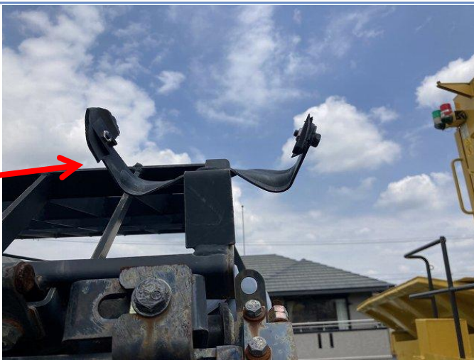
CAB上左側ライトステー変形