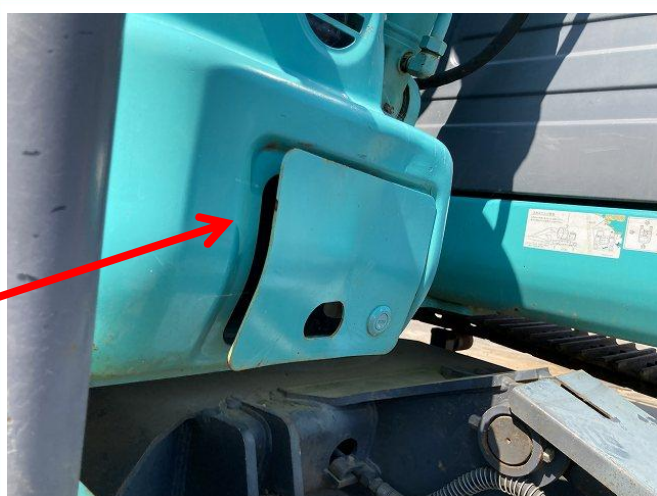
小物収納カバー変形②