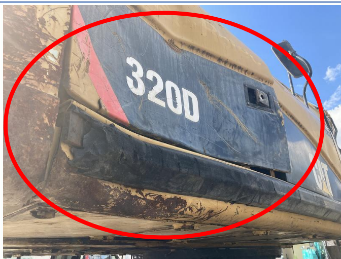
サイドカバー(ポンプ側) 及びDフレーム変形