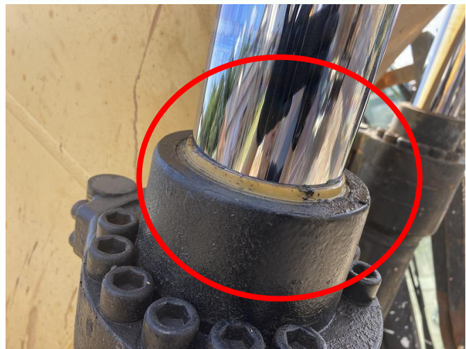
ブームシリンダー1本オイル漏れ