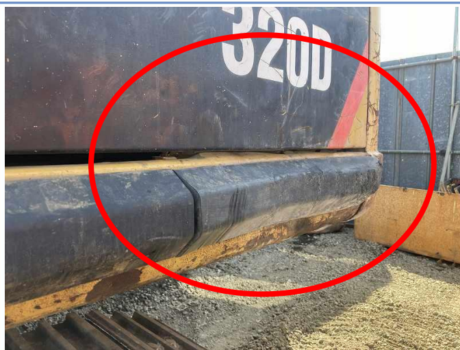
サイドカバー(ラジエータ側) 及びDフレーム 変形