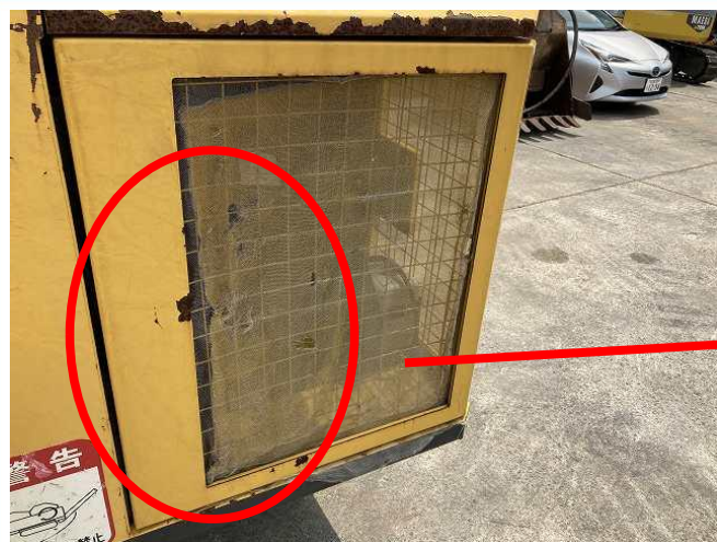
グリルネットほつれ①