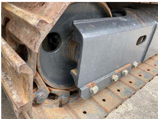
シューリンク伸び(左側)②