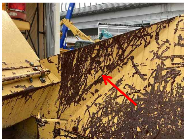
投入ホッパーへこみ(表側)