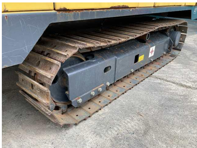
シューリンク伸び(左側)①