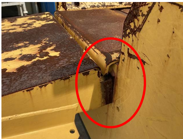
投入テーブルクラック(左側)