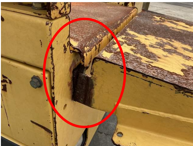
投入テーブルクラック(右側)