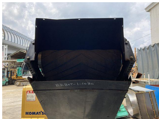
コンベアベルト偏り気味