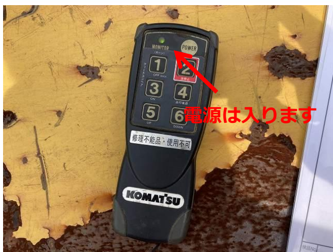
ラジコン動作不能