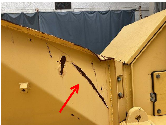
投入ホッパーへこみ(裏側)