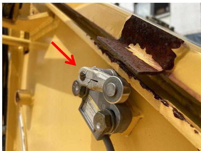
フード開閉センサー固着気味