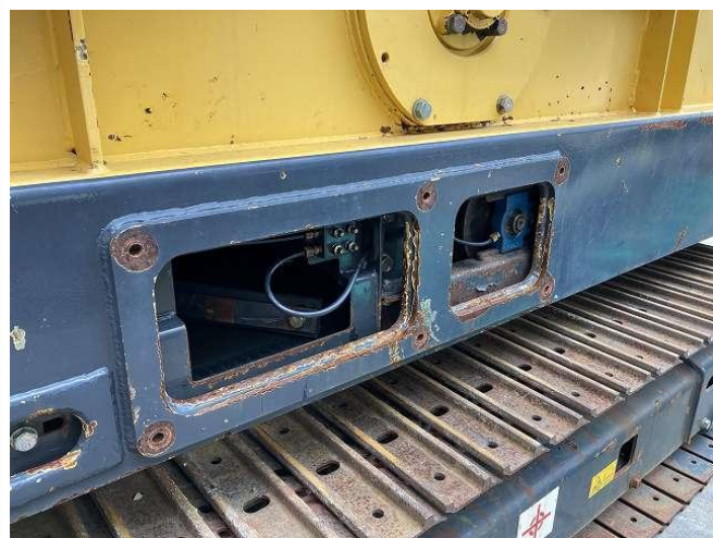
給脂口カバー欠損