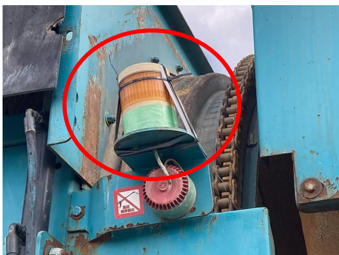
走行サイレン取付不良(動作OK)