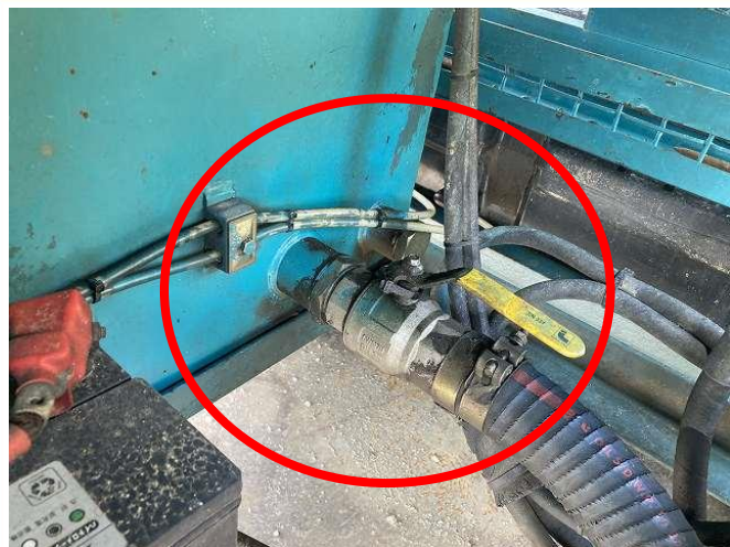
サクシヨンホースよりオイル漏れ