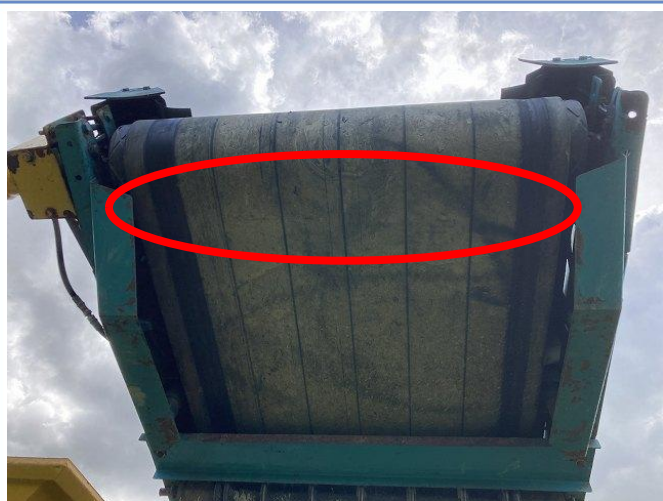
テールコンベアスクレーパー欠損