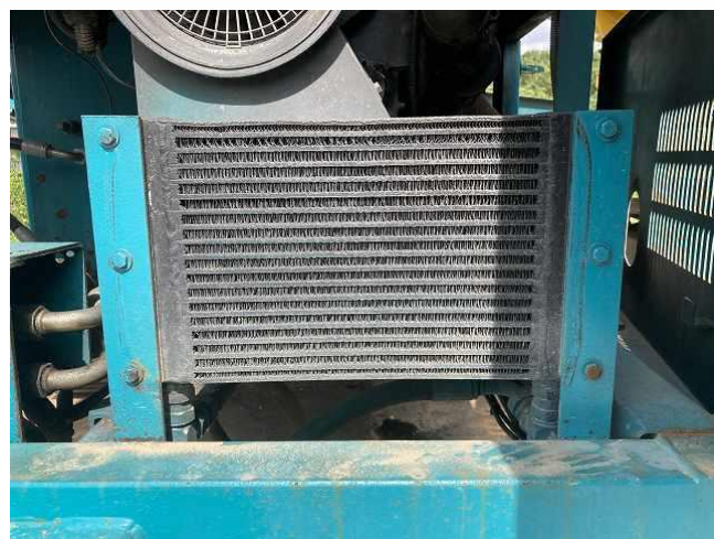
オイルクーラー正面