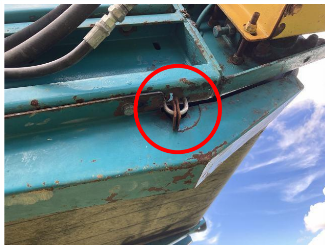
同スクレーパー取付部②