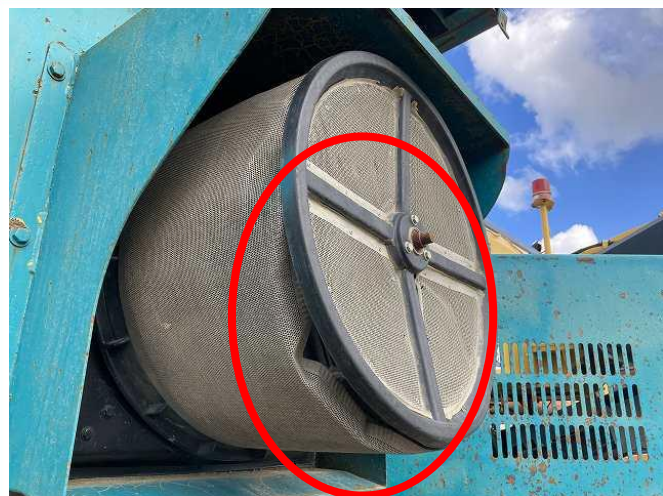
オイルクーラーメッシュカバー変形あり