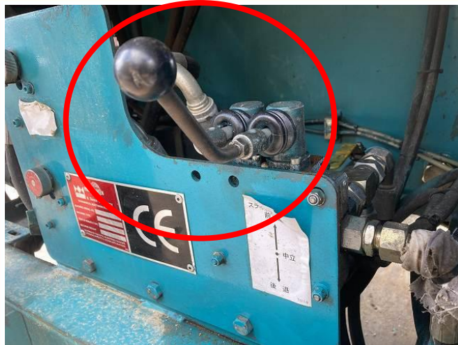
レバーバルブよりオイル漏れ