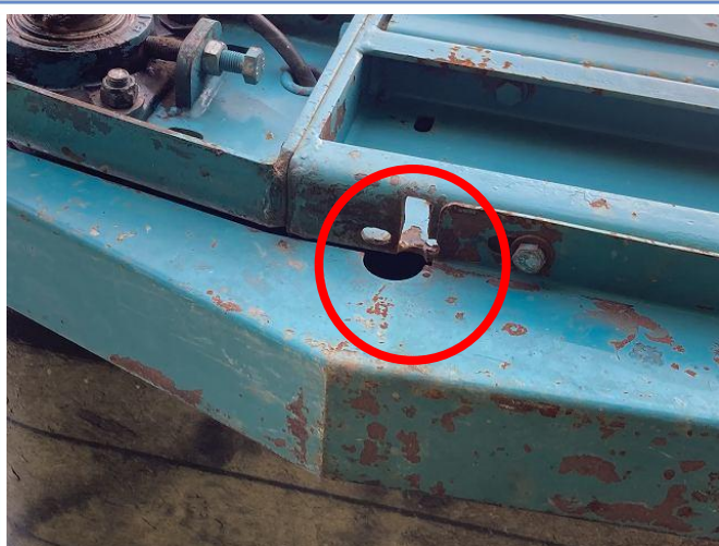
同スクレーパー取付部①