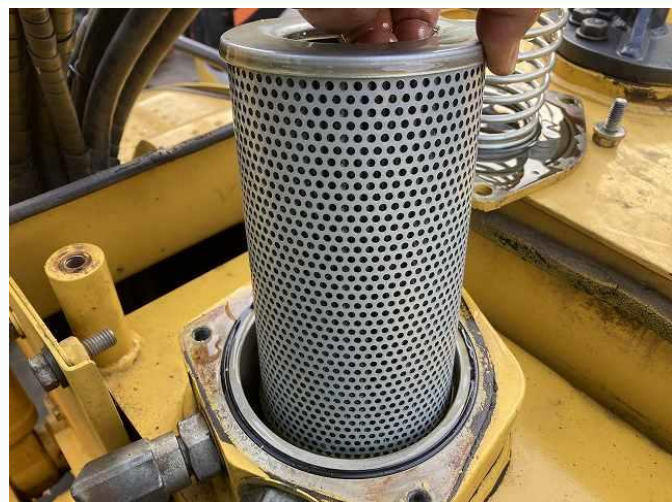
作動油及びエレメント交換