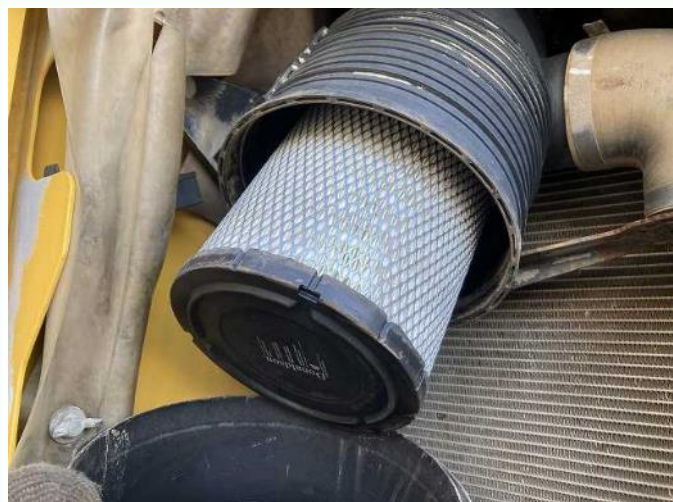
エアエレメント交換