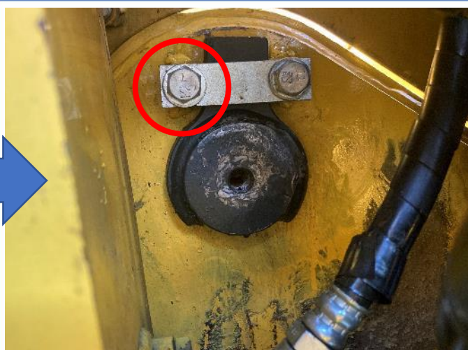
ブームフットピン固定ブロック折損修理、プレート交換