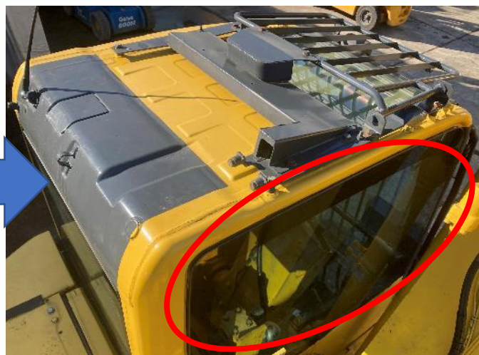
キャブ右側ガラス交換