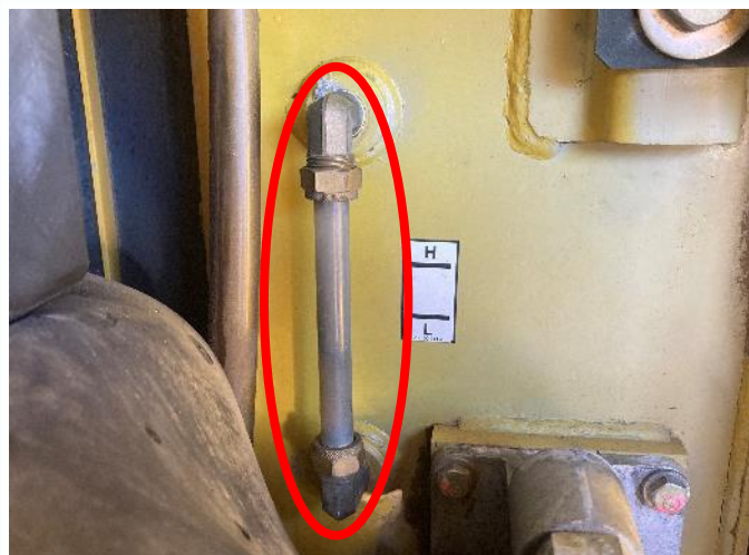
作動油タンクゲージ曇り