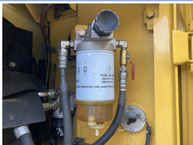
燃料エレメント交換