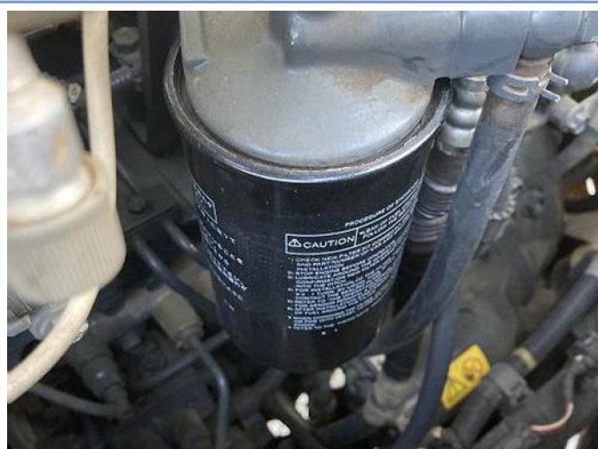
エンジンオイル及びエレメント交換