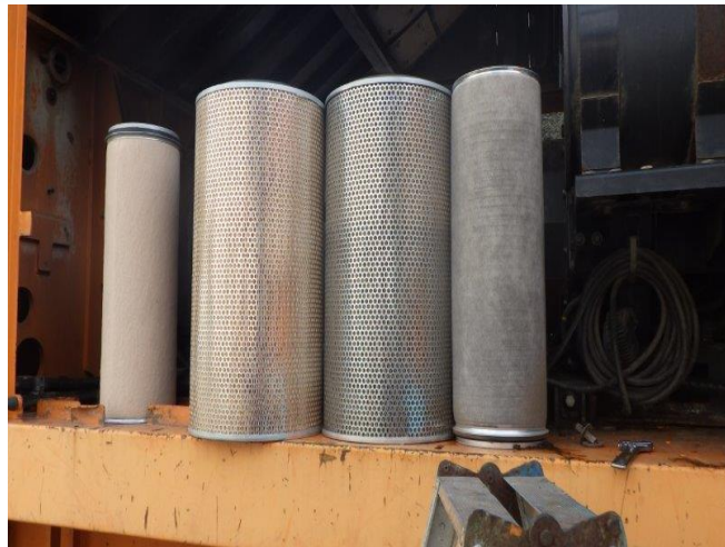
エア-エレメント インナー アウター 交換