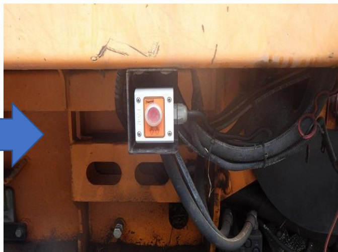
スイッチ交換(後部スイッチBOX操作 解除スイッチ)