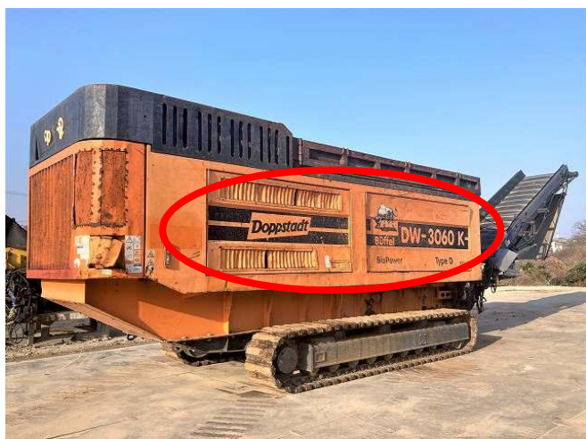
サイドカバー変形 1