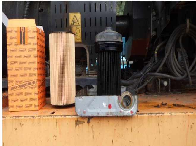
エンジンオイル・エレメント交換