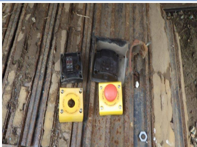
非常停止スイッチ交換