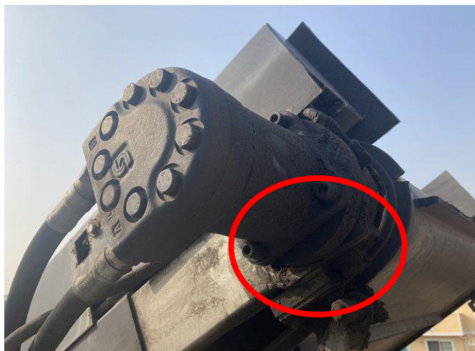
コンベアモーター軸シール油にじみ