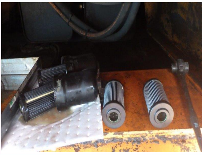
走行用 作動油エレメント交換