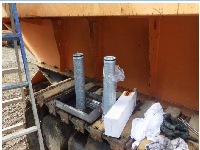
作動油エレメント交換