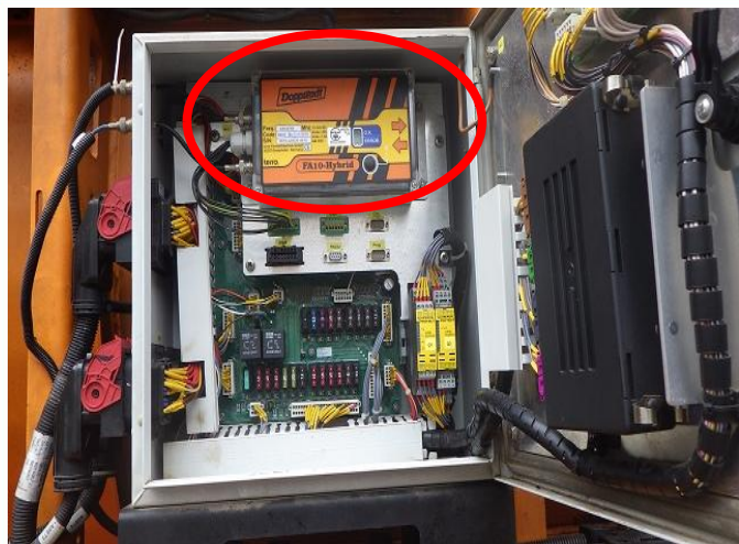
コントローラー基盤交換