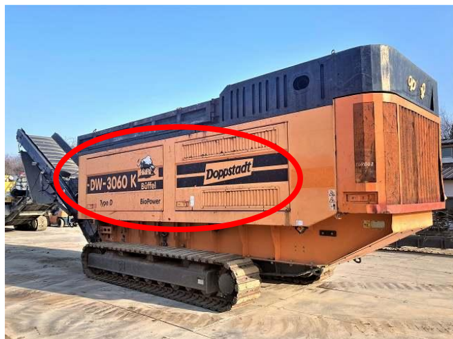
サイドカバー変形 2