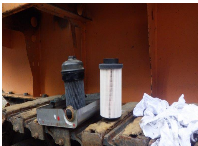
燃料エレメント交換