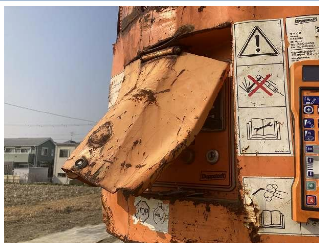
操作パネルカバー変形