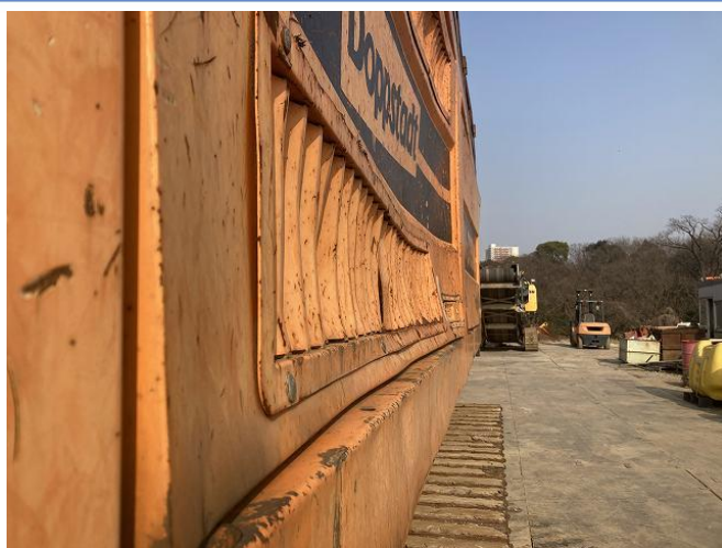
サイドカバー変形 3