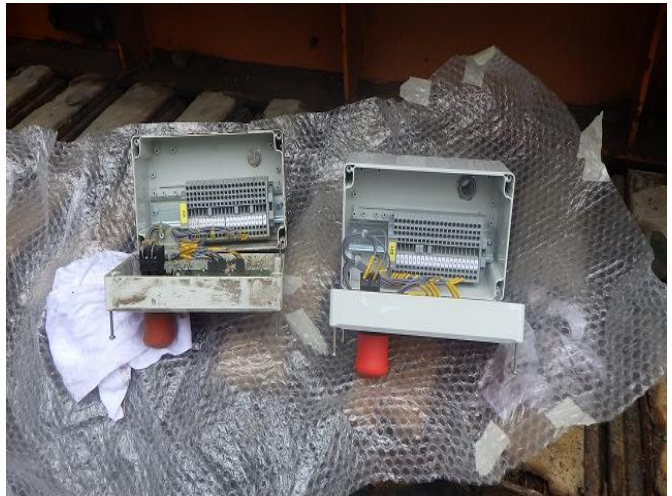
後部 スイッチBOX交換(排出コンベア格納 展開)