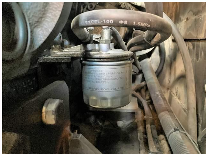
燃料エレメント交換