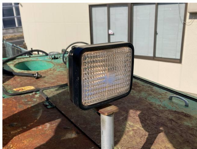
フロントライト点灯不良修正