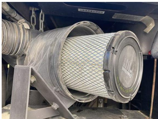
エアエレメント交換