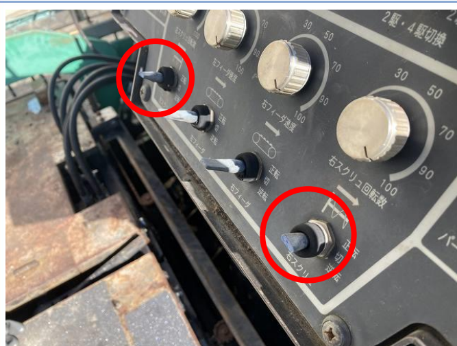
操作盤トグルスイッチ折損