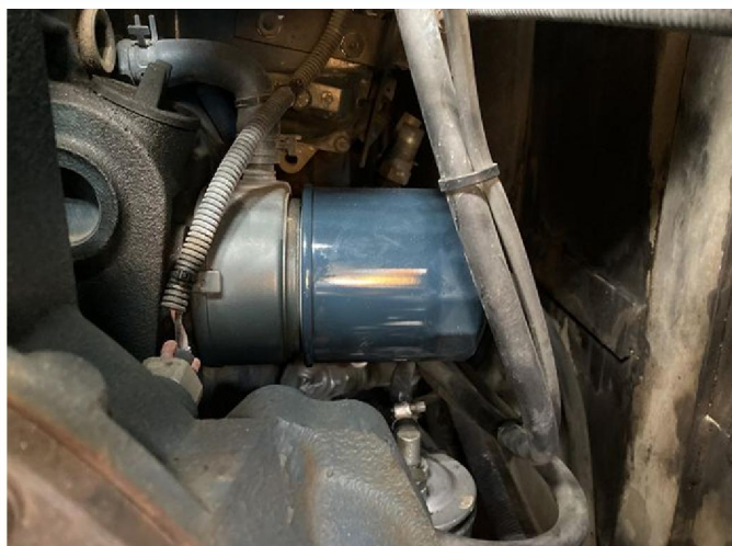
エンジンオイルエレメント交換