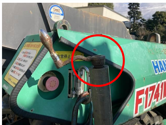
グレードセンサーバー ハンドル固着