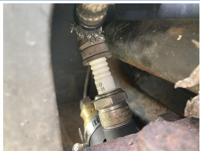
中央スクリード/右スクリード プロパンバーナー、点火プラグ交換