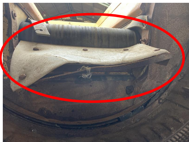
原料投入シュート変形