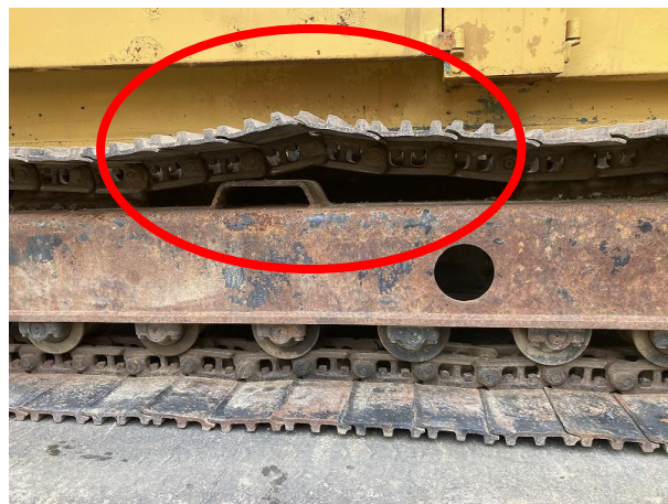
トラックリンク固着箇所あり