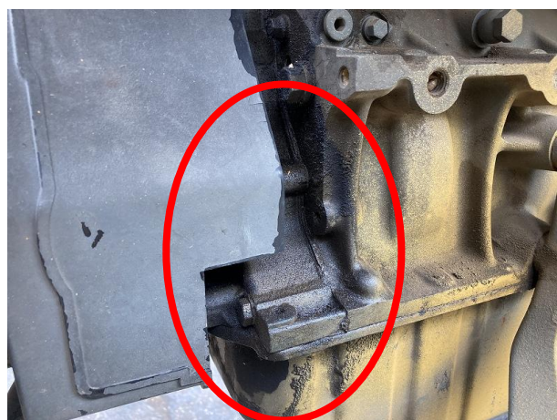
EGタイミングケース継ぎ目より油漏れ