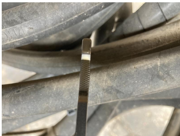
エンジンオイル交換