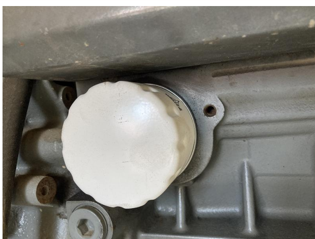
エンジンオイルエレメント交換