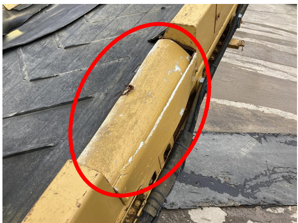
テールCV折畳み部カバー破損