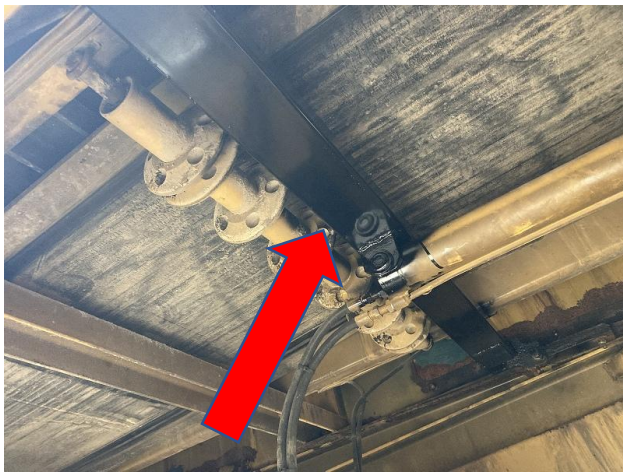
フィーダースライドCY受け製作