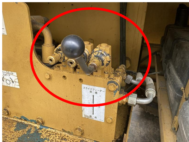
フィーダー操作レバーより油漏れ