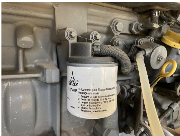
燃料エレメント交換