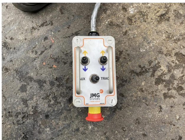
走行用リモコン新品