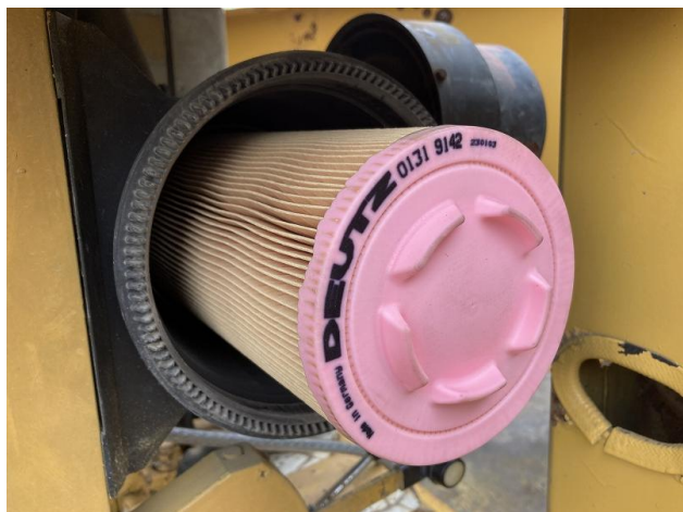
エアエレメント交換