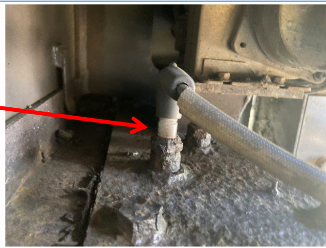
バーナー点火プラグ2本交換