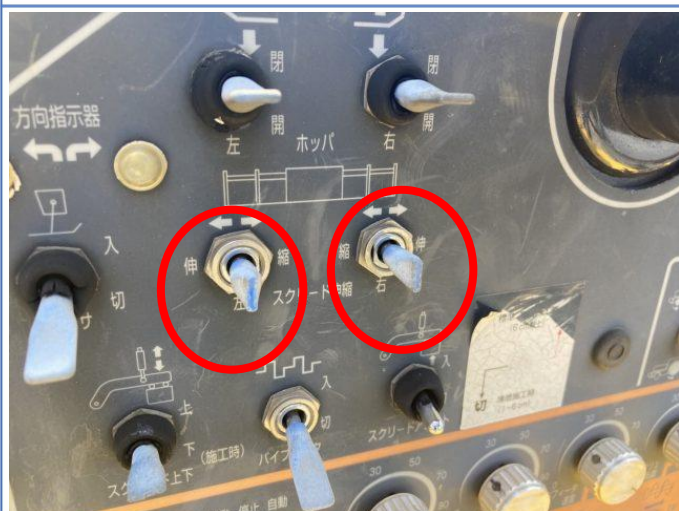
スクリーン伸縮用トグルスイッチ折損