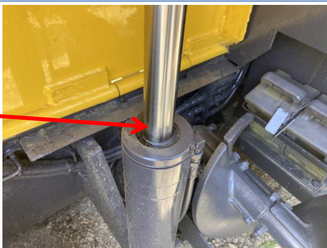
左ホッパーシリンダーO/H