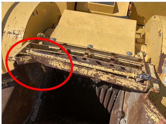
クラッシャー上部保護カバー変形