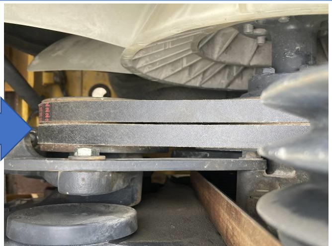
ファンベルト交換