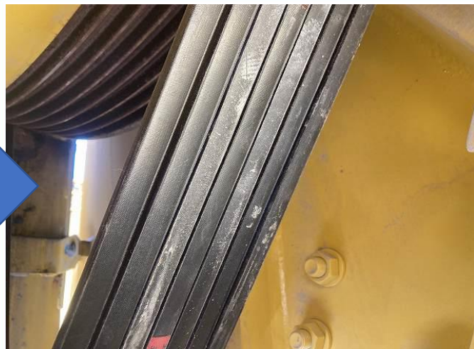
クラッシャーベルト交換