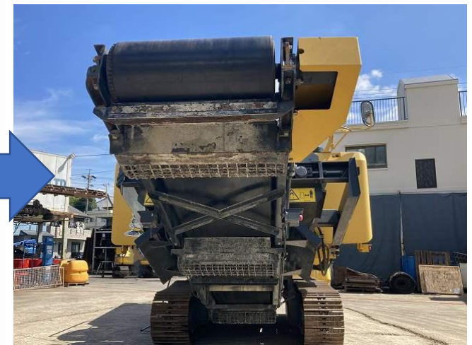
排出コンベアベルト交換