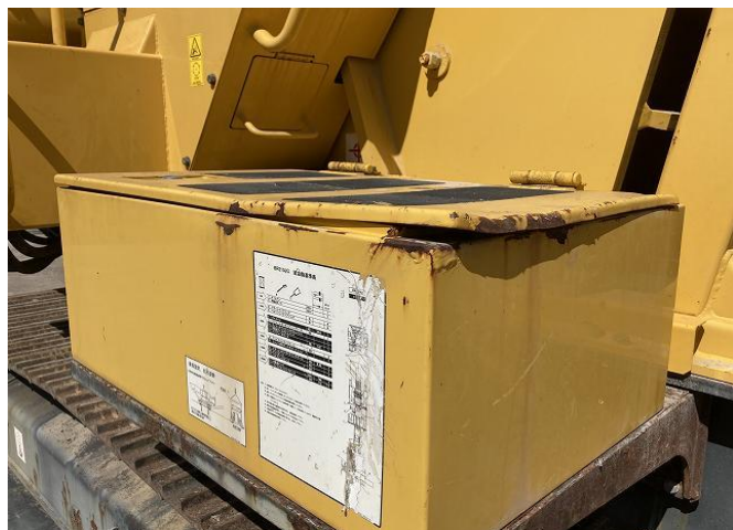
バッテリーケース変形