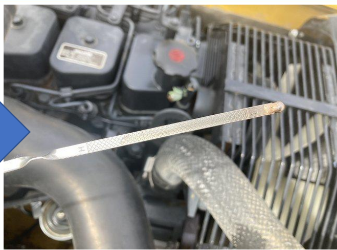
エンジンオイル交換