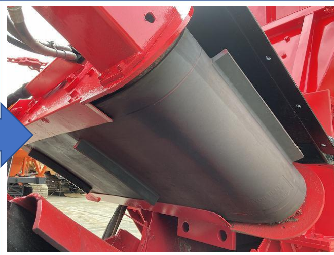
磁選機コンベアベルト交換