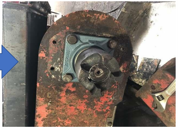
磁選機ベアリング交換(2個)