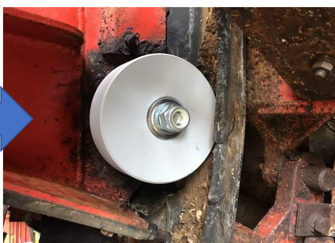
ベルコンガイドローラー交換(左右)