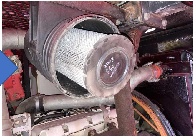
エアエレメント交換