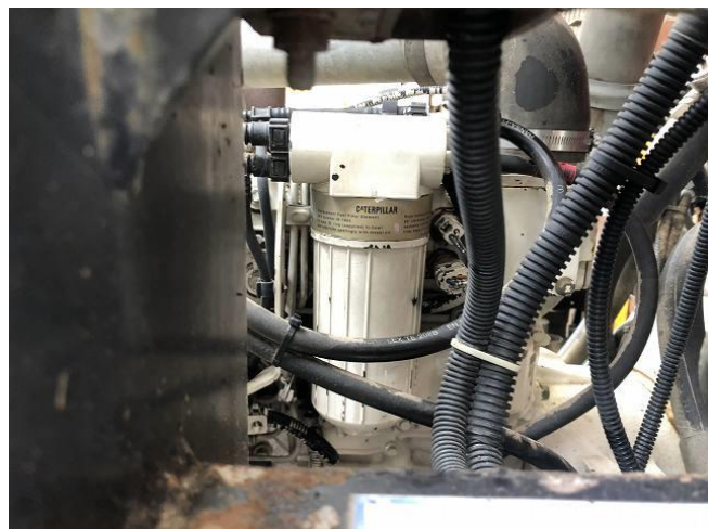
ウォーターセパレーター交換