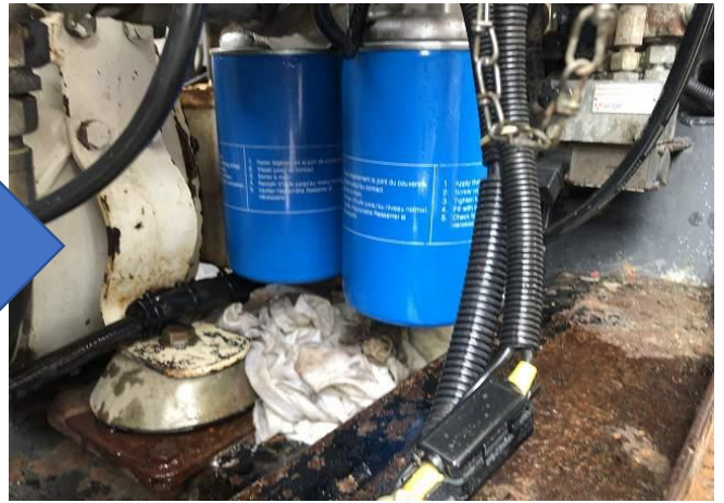
作動油交換、作動油エレメント交換