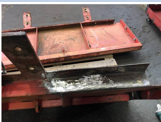
ホッパーあおり変形箇所板金修正