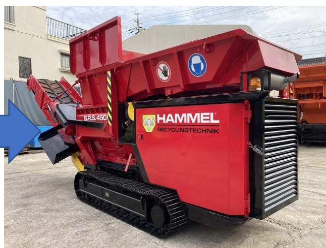
本体外観（全塗装済）