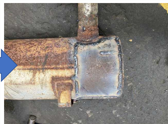
マフラー太鼓穴あき部補修