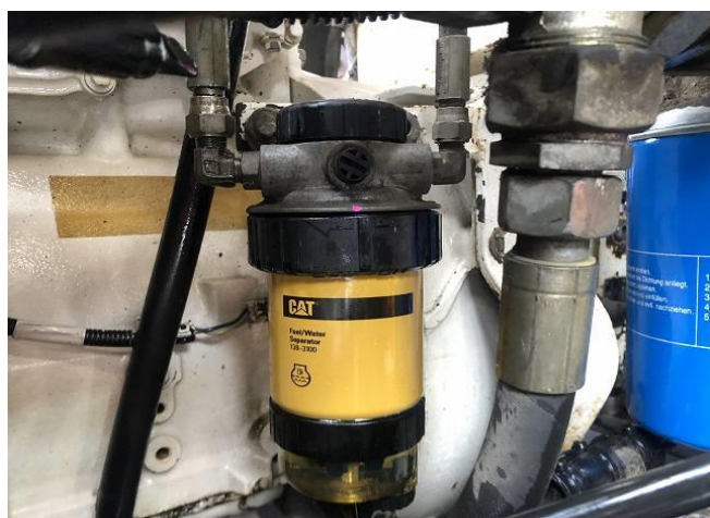
燃料エレメント交換