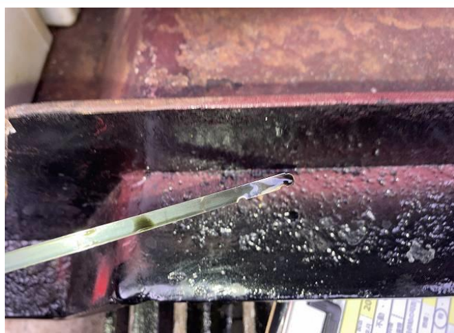
エンジンオイル交換