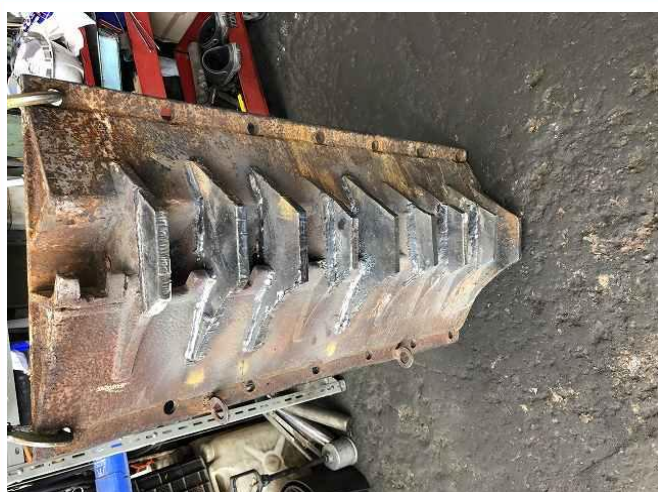
サイドコム先端切断修復