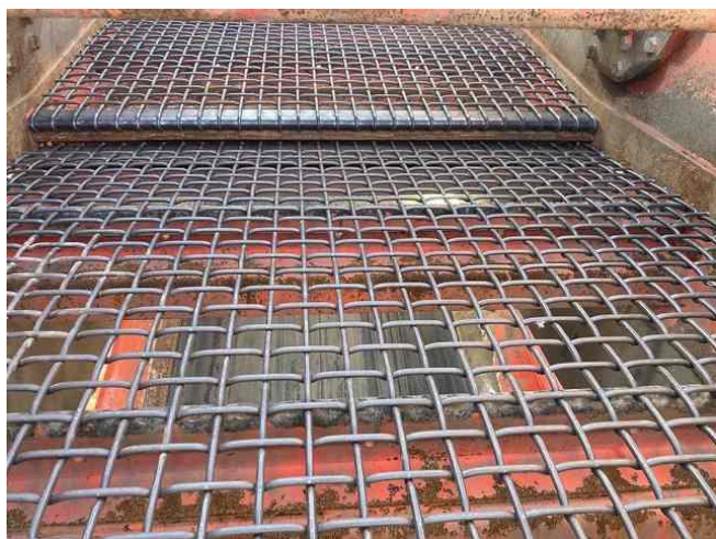
下段の網新品取付(織網40×40mm)