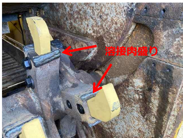
ソイルカッターホルダー肉盛り