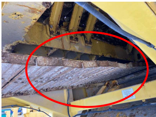
原料フィーダーベルトに固着箇所あり