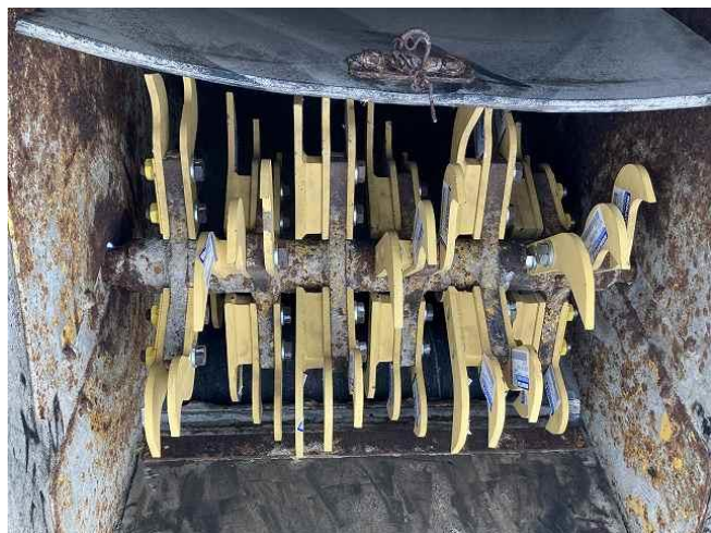
アフターカッター全数新品交換