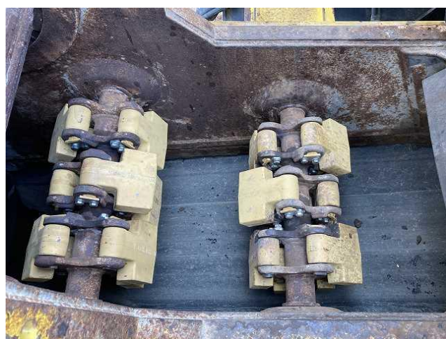
ロータリーハンマー全数新品交換