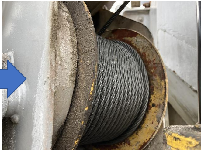
クレーンワイヤー交換