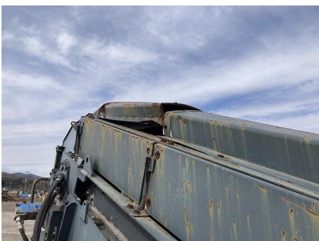
排出コンベアカバー変形