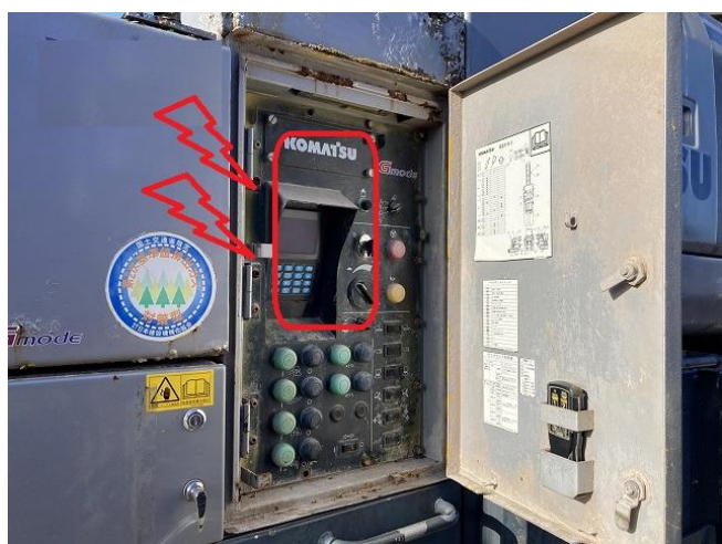
メインコントローラー交換