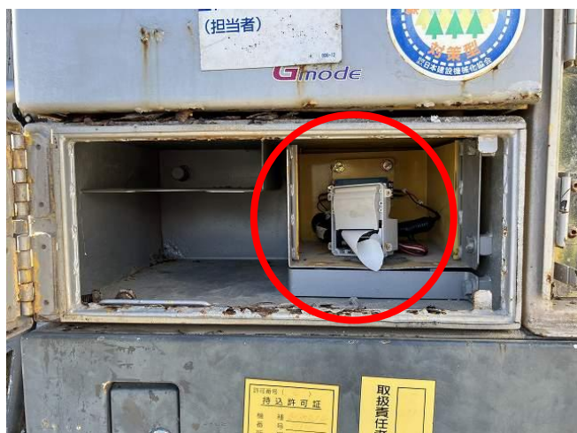
記録プリンター破損