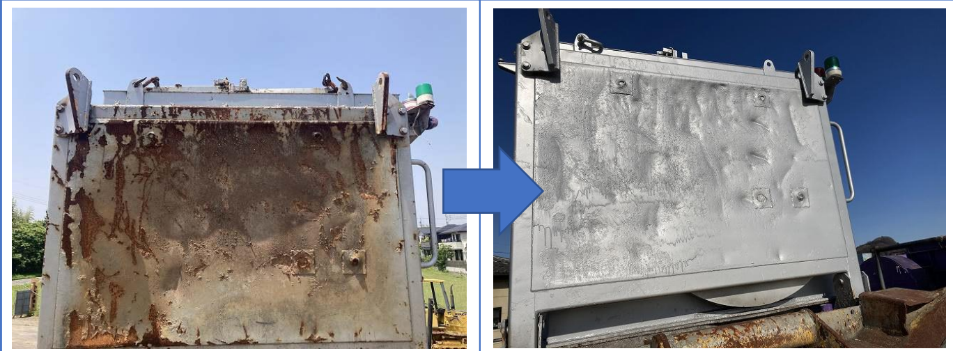
固化材ホッパー背面ガード塗装