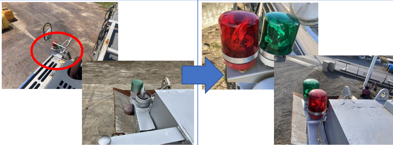
回転灯配線修理及び交換(LED)