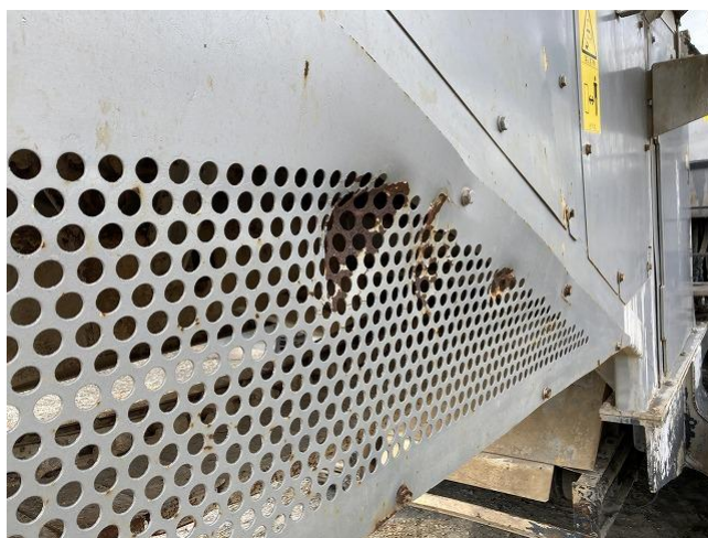
土砂ホッパー下サイドガード凹み