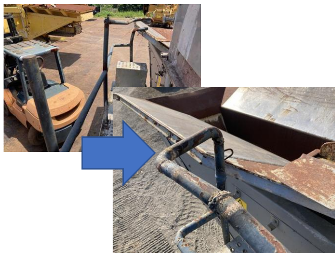
各部溶接補修(例：手すり類)