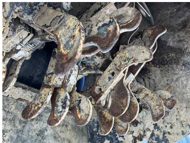
アフターカッター摩耗(1~2枚欠損)