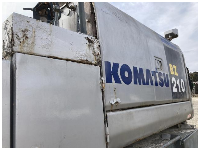
本体カバー類錆び①