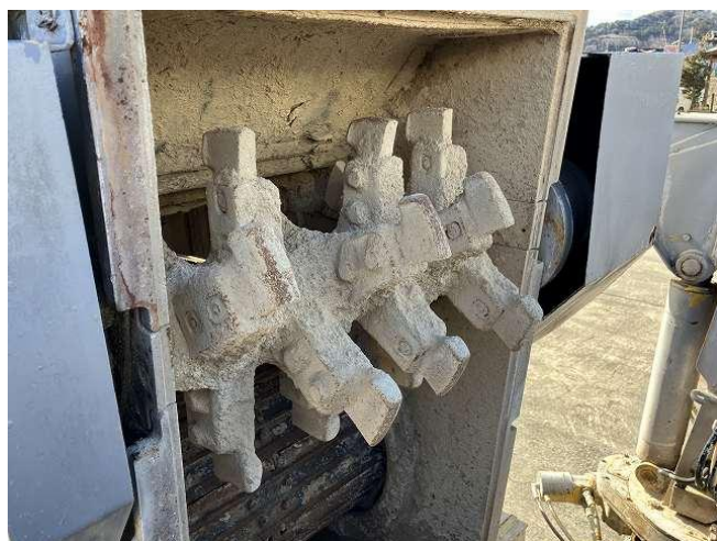
ソイルカッター摩耗(純正外品)