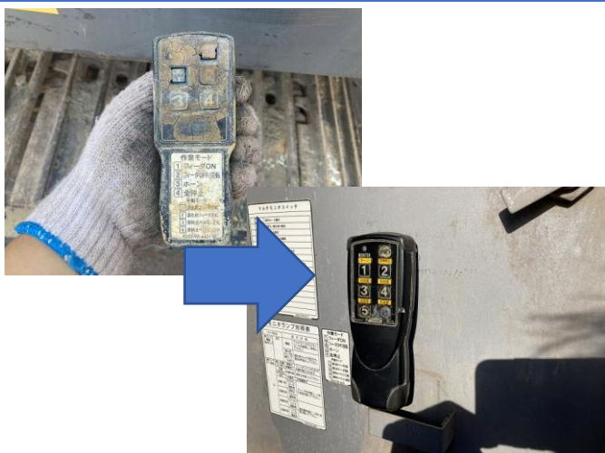
本体ラジコン交換(中古品)