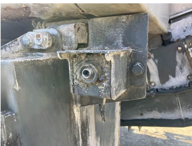
非常停止ボタン欠損