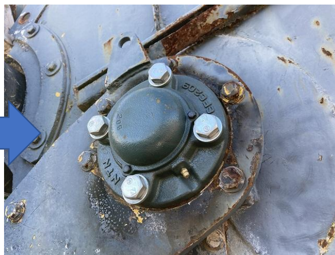
アフターカッターベアリング交換