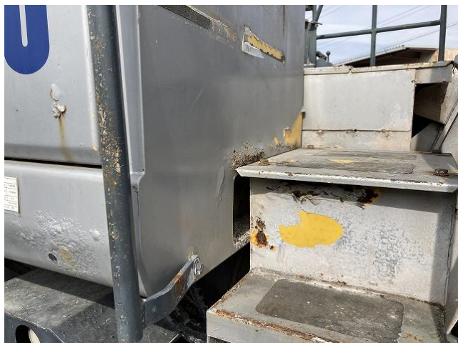
本体カバー類錆び②