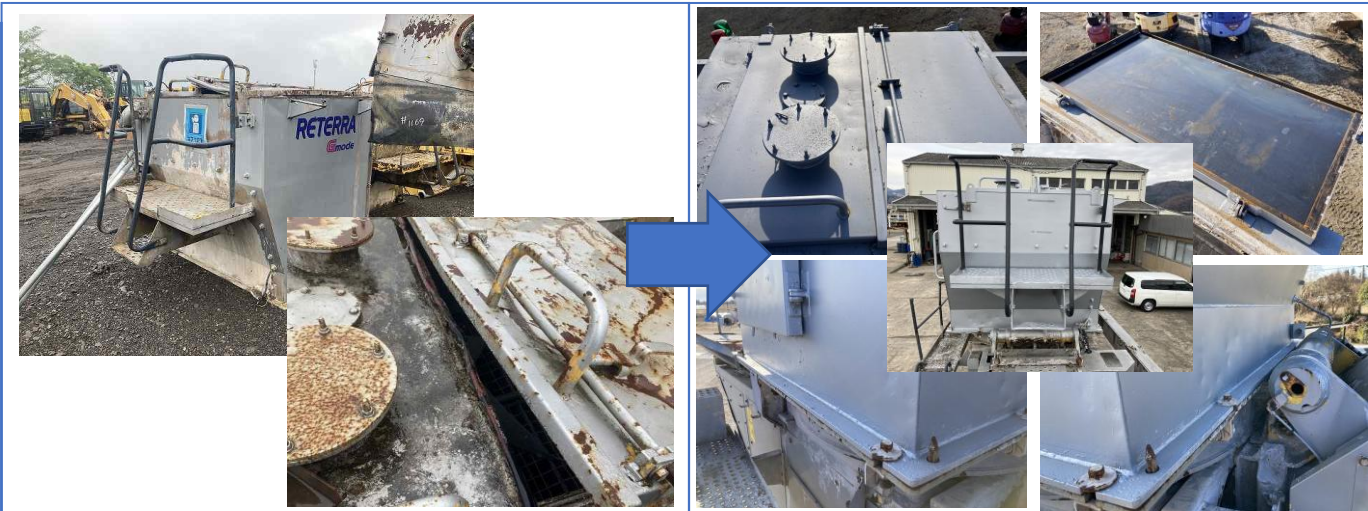
固化材ホッパー修復及び塗装