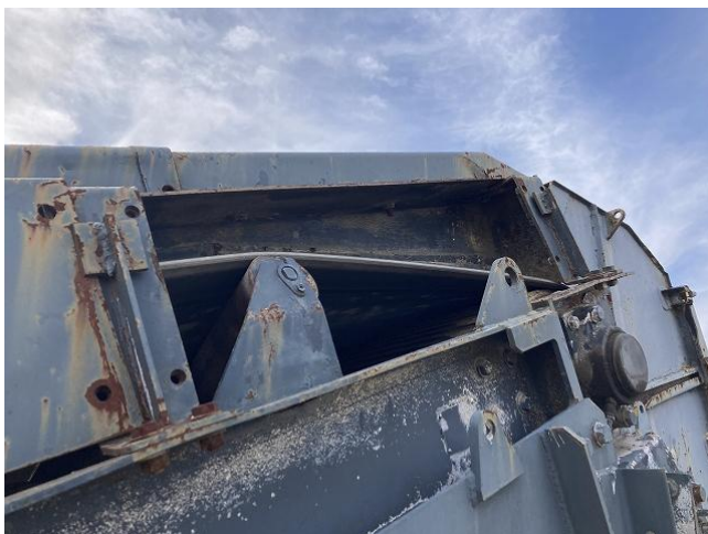
排出コンベアカバー欠損