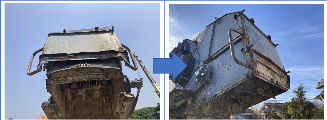
排出コンベアエンド部カバー板金