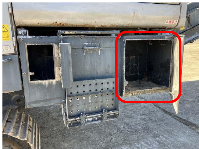
清掃用コンプレッサー取り外し