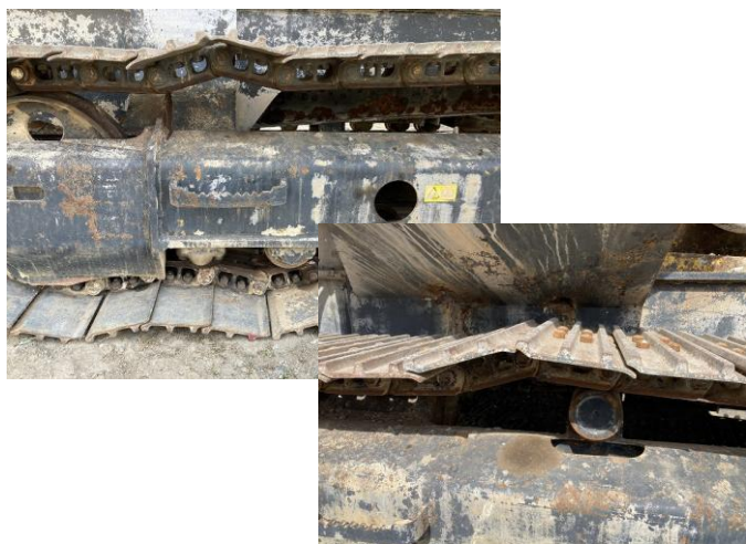
クローラーキンク(2~3か所)