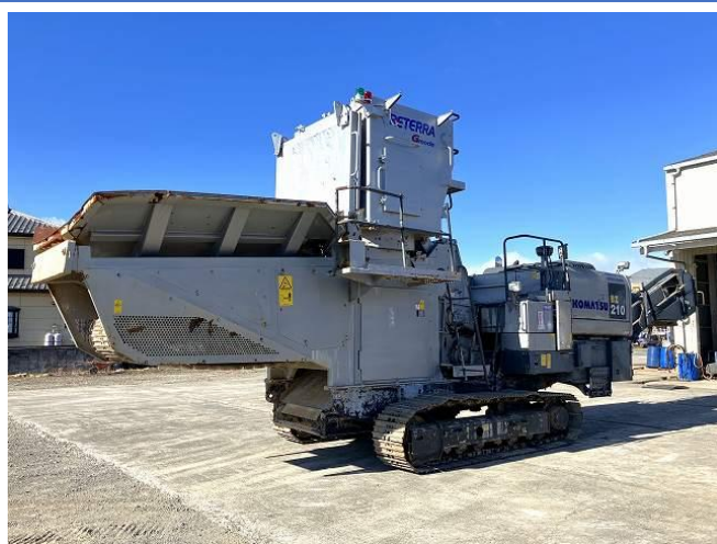
本体外観(純正外カラー)