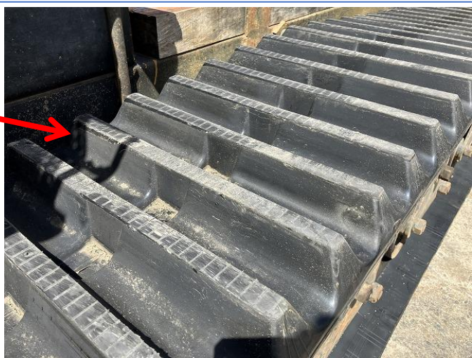
左右ゴムクローラー新品へ交換